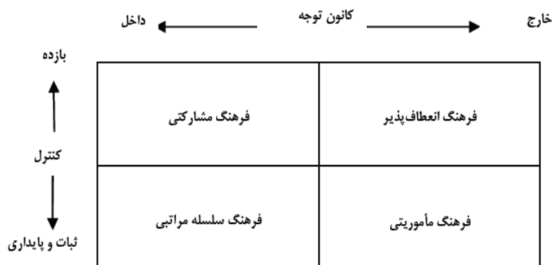
شکل ۱: گونه یابی راهبردهای فرهنگ بر اساس مدل یک پارچه

۱- فرهنگ سلسله مراتبی: در حالتی که نیازهای محیط، ثابت و پایدار بوده و کانون توجه سازمان به داخل است، در این فرهنگ‌ها به امور داخلی سازمان توجه شده و این راهبرد برای محیط‌هایی مناسب است که از ثبات نسبی برخوردار باشد.