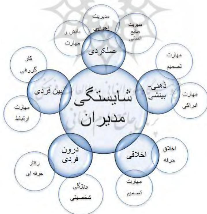
شکل شماره ۱: مدل مستخرج از بخش کیفی تحقیق

با توجه به مراحل کدگذاری، مدل مستخرج از بخش کیفی در قالب شکل شماره ۱ گزارش شده است.