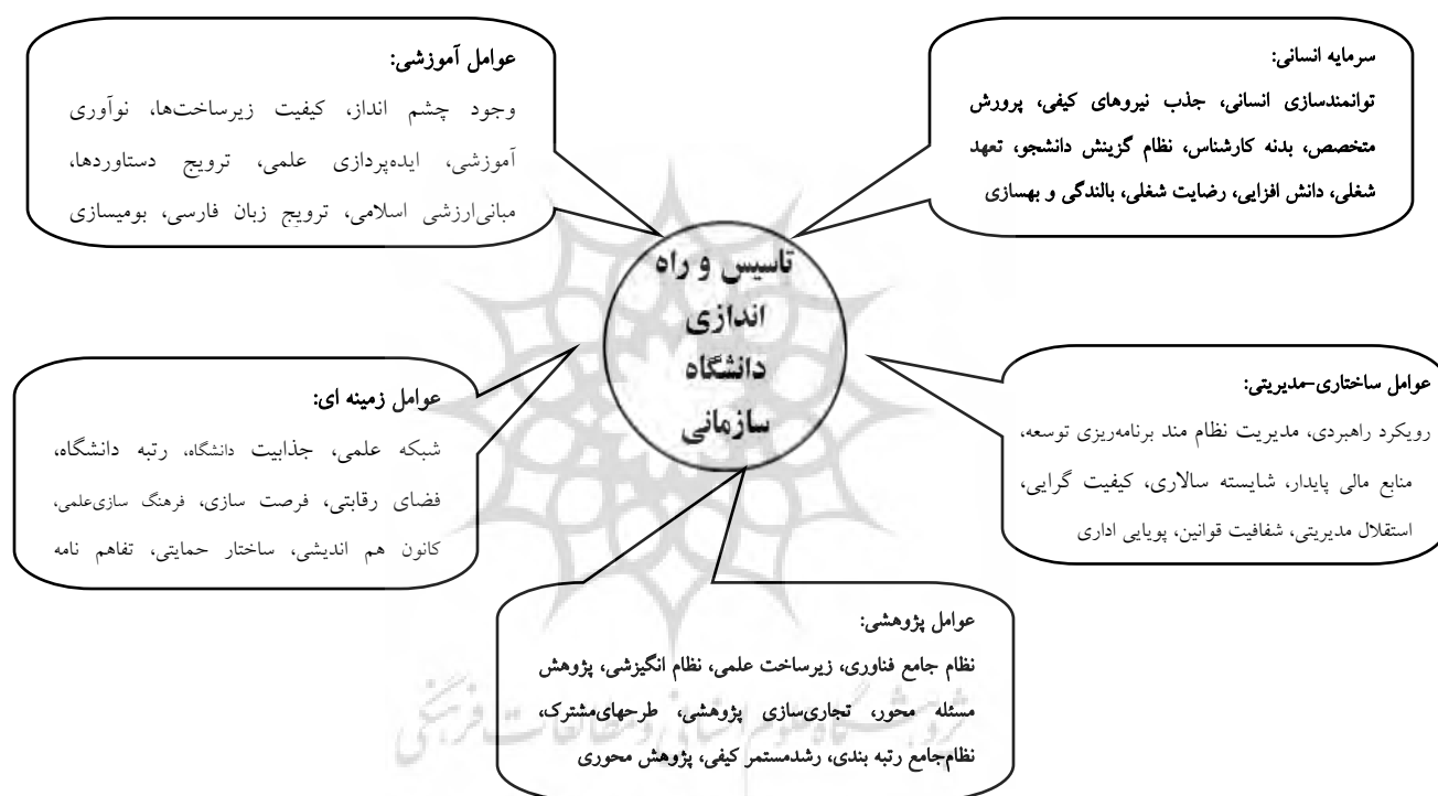
شکل ۲: مدل جامع تحقیق بر اساس یافته‌های محقق

در رتبه اول اهمیت و زیر عامل پژوهش محوری آموزش و مسئله محوری پژوهش با وزن نسبی ۰/۱۲۷۸ در آخرین رتبه قرار گرفت. از میان ۹ زیر عامل سرمایه انسانی، زیر عامل تربیت و توانمندسازی سرمایه انسانی خودباور، چندبعدی، ماهر و کارآفرین با وزن نسبی ۰/۲۲۳۶ مهم ترین زیرعامل و زیرعامل برنامه‌های توانمندسازی، بالندگی و بهسازی کارکنان دانشگاه با وزن نسبی ۰/۰۸۷۸ در کمترین اهمیت قرار گرفت. سرانجام، بر اساس نظرات حاصل از هم اندیشی خبرگان در مجموع؛ وجود چشم انداز و برنامه سرآمدی نظام آموزش دانشگاه در رتبه اول اهمیت با امتیاز ۰/۲۵۴۴ قرار گرفته و بعد از آن وجود نظام جامع پژوهش و فناوری بر اساس اسناد بالادستی با حدنصاب ۰/۲۴۷۵ در جایگاه دوم و همچنین وجود شبکه علمی هم افزای ملی و فراملی با امتیاز ۰/۲۳۳۳ در جایگاه سوم قرار گرفته است.