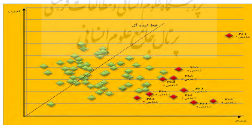
نمودار ۱. ماتریس اهمیت-شدت

همان گونه که در نمودار ۱ مشخص است عوامل بحرانی بر حسب میزان فاصله از ایده آل و شاخص مورد انتظار رنگ بندی شده اند. گویه های به رنگ قرمز، مولفه های بحرانی تحقق مدیریت راهبردی منابع انسانی هستند که توجه و رسیدگی به آن ها می تواند موجبات تحقق این مهم را فراهم آورد. نکته قابل توجه در این نمودار این است که هر اندازه فاصله بزرگتر شده و از لحاظ شماتیک نقطه از خط ایده آل دورتر شود، بر میزان بحرانی تر بودن مولفه افزوده می شود. لازم به ذکر است از آنجا که منطق تعیین بحرانی بودن فاصله نقطه همزمان از ایده آل شدت و ایده آل اهمیت است و از آنجا که این دو به نسبت یکدیگر (در رابطه محاسبه فاصله) مد نظر قرار می گیرند، توزیع نقاط بدین شکل به دست آمده است. این بدان معناست که هر چه یک نقطه از اهمیت بیشتری برخوردار باشد، شدت آن بیش از سایرین مدنظر قرار می گیرد که این مساله نحوه شناسایی نقاط را نسبی نموده است.