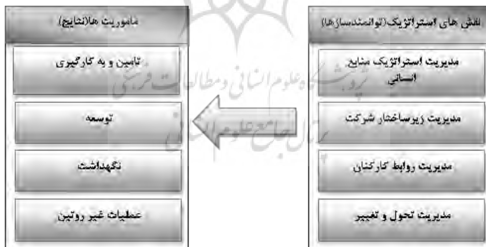
شکل ۲. مدل مفهومی پیشنهادی

با در نظر گرفتن سایر مدل ها و ساختار راهبردهای منابع انسانی، از شکل ۲ برای شناسایی و استخراج نقش های راهبردی واحدهای منابع انسانی استفاده شده است. نوآوری این پژوهش اتصال نقش های راهبردی منابع انسانی به مأموریت منابع انسانی سازمان است.