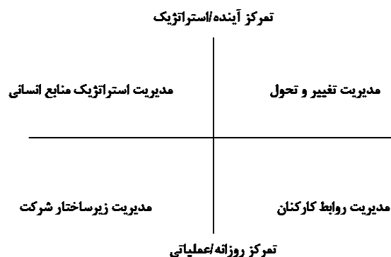
شکل ۲. نقش های منابع انسانی در ایجاد یک سازمان رقابتی (۱۳)

(۱۲). چارچوب شکل ۲ که توسط اولریش ارائه شده است، چهار نقش کلیدی که متخصصان منابع انسانی باید برای خلق ارزش انجام دهند، را توصیف می کند. به اعتقاد اولریش، دامنه تمرکز منابع انسانی از بلندمدت-راهبردی تا کوتاه مدت- عملیاتی در تغییر است و متخصصان منابع انسانی باید یاد بگیرند که هم راهبردی و هم عملیاتی عمل کنند.