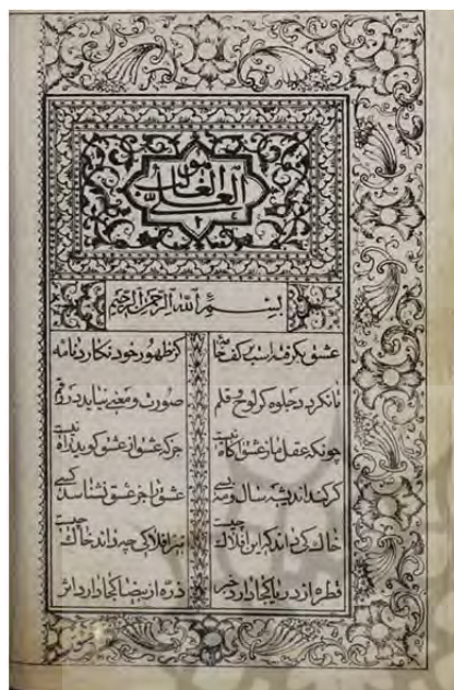
تصویر ۳. صفحه آغاز منظومه عشق نامه تألیف اسدالله غالب طهرانی منتشره به سال ۱۲۸۳ ق. در تبریز (کتابخانه ملی)

متأسفانه اطلاعی از اینکه بعد از جعفرقلی خان چه کسی بر این مسند نشسته نداریم، اما مطابق اسناد و اطلاعاتی که در دست است مشخص می‌گردد که از سال ۱۲۹۰ ق. فردی با نام اسدالله خان حداقل تا سال ۱۳۱۱ ق. به عنوان کتابدار کتابخانه مدرسه دارالفنون مشغول به کار بوده است. ۱