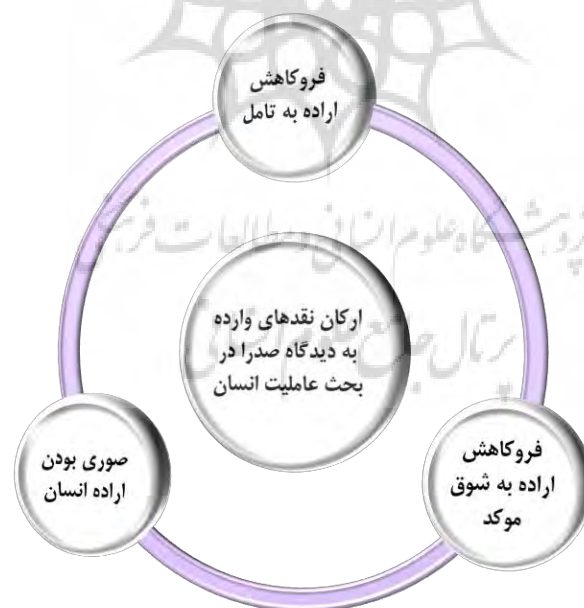
نمودار شماره ۲. مهمترین نقدهای وارده بر عاملیت انسان در دیدگاه ملاصدرا

ملاصدرا که در نظریات خود، اضطراری بودن افعال ارادی انسان را پذیرفته است. او سعی دارد تا از طریق فاعل بالتسخیر و نیز توحید