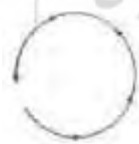
شکل ۳: طرح‌واره چرخه‌ای (Johnson, 1987: 120)

این طرح‌واره، یکی از اشکال طرح‌واره حرکتی است. «بقا و حفظ حیات ما انسان‌ها، وابسته به یک سری از فعالیت‌های مکرر و قاعده‌مند چرخه‌ای در بدنمان است؛ مانند ضربان قلب، تنفس، خواب و بیداری، گوارش و... بسیاری از پدیده‌های اطراف ما در جهان نیز به صورت چرخه‌ای رخ می‌دهند؛ مانند شب و روز، تغییر فصول، تولد و مرگ، رشد گیاهان و حیوانات. این چرخه با یک نقطه آغازین شروع می‌شود و یک توالی از حوادث مرتبط را طی می‌کند و در جایی که آغاز شده بود، به پایان می‌رسد تا چرخه جدیدی را از نو آغاز کند» (Ibid: 120). الگوی طرح‌واره‌ای یک چرخه به شکل زیر است: