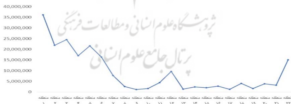
نمودار ۱- توزیع تعهد درآمدی مناطق در سال ۱۴۰۱

تعیین میزان تعهد درآمدی شهرداری تهران تا کنون به صورت پیش بینی درآمد سال آینده بر مبنای بررسی عملکرد گذشته اجرایی شده که همراه با معضلات و مسائلی چون فشار مضاعف درآمد بر روی تعداد محدودی از مناطق بوده است به گونه‌ای که در سال ۱۴۰۱، میزان ۷۵.۱۴ درصد از کل درآمد مناطق بر عهده ۷ منطقه بوده و چیزی کمتر از ۲۵ درصد از درآمد بر عهده ۱۵ منطقه مابقی بوده که سهم هر منطقه حدود ۱.۶ درصد از کل درآمد شده است. ادامه تخمین درآمد به این روش در سال‌های آینده موجبات توسعه هفت منطقه‌ی مذکور را فراهم آورده و نیز باعث تجمع شرکت‌های حقیقی و حقوقی سرمایه‌گذار در این مناطق شده و در نتیجه ناهمگونی شهر را به همراه خواهد داشت