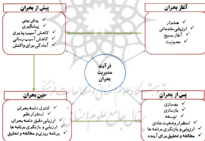
شکل (۱): فرآیند مدیریت بحران

چرخه مدیریت یکپارچه بحران به چهار مرحله ملی تقسیم شده است. پیشگیری و کاهش اثرات، آمادگی، پاسخ و واکنش در برابر بحران و بازگشت به وضعیت قبل از سانحه(ایلکا، ۱۳۹۱: ۳۰۹). (ناصری فر، ۱۳۸۰: ۴۶). از مهمترین اقدامات یا شاخص‌های آغاز بحران می‌توان به هشدار، ارزیابی مقدماتی، آغاز بسیج و مصونیت اشاره نمود. اقدامات پیش از بحران شامل پیش‌بینی، پیشگیری، کاهش آسیب‌پذیری؛ در حین بحران بایستی کنترل دامنه بحران، استقرار نظم، ارزیابی دقیق دامنه بحران و هم‌چنین در پس از بحران بایستی به‌سازی، بازسازی، استقرار وضعیت عادی و مطالعه و تحقیق مورد تأکید باشد(صیوری، ۱۳۹۶: ۱۴).