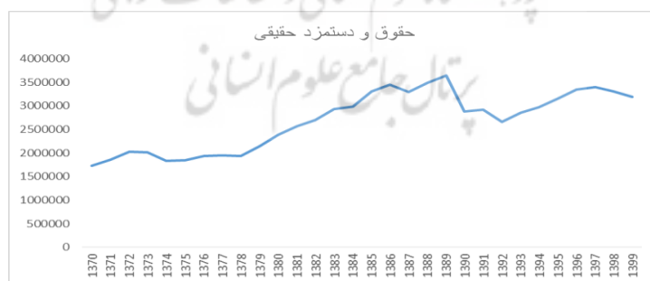
نمودار ۲- روند حقوق و دستمزد سالانه حقیقی، به قیمت ثابت سال ۱۳۹۵ (تومان)

در مدل بالا WG به عنوان حداقل حقوق و دستمزد سالیانه حقیقی (به قیمت ثابت سال ۱۳۹۵) معرفی می‌شود. برای این منظور و انجام بررسی‌های دقیق، حداقل حقوق و دستمزد اسمی تعیین شده را براساس شاخص قیمت مصرف کننده (CPI) تبدیل به حقوق و دستمزد حقیقی کردیم. (نمودار ۲) شایان ذکر است که آمارهای مربوط به حداقل حقوق و دستمزد را از وزارت کار و امور اجتماعی به دست آمده است.