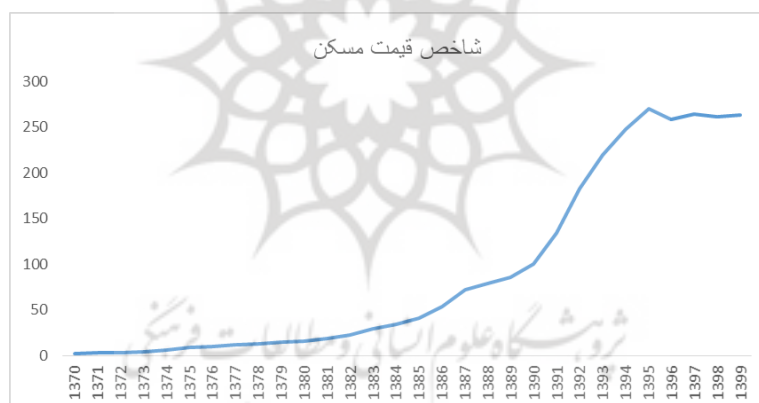
نمودار ۳- روند شاخص قیمت مسکن به قیمت ثابت (ماخذ: بانک مرکزی)

در این پژوهش به عنوان ارزش افزوده بخش خدمات مورد بررسی قرار می‌گیرد. در این پژوهش ارزش افزوده بخش خدمات به قیمت ثابت سال ۲۰۱۵ در نظر گرفته شده است. EMS در این پژوهش معرف نسبت شاغلان بخش خدمات نسبت به کل شاغلان کشور می‌باشد. آمارهای مربوط به این متغیر از سایت مرکز آمار ایران استخراج شده اند. LR به عنوان نرخ سواد بزرگسالان در این مطالعه مورد بررسی قرار می‌گیرد. نرخ با سواد در هر جامعه از تقسیم تعداد افراد با سواد در یک سن یا گروه سنی معین به جمعیت آن سن یا گروه سنی محاسبه می‌شود. نرخ با سواد ارائه شده مربوط به جمعیت ۶ سال و بالاتر می‌باشد. آمارهای مربوط به این متغیر را از سایت بانک مرکزی ایران استخراج کرده ایم. HPI دیگر متغیر مورد بررسی در این پژوهش می‌باشد که به عنوان شاخص قیمت مسکن مورد بررسی قرار می‌گیرد. شاخص قیمت مسکن به قیمت ثابت سال ۱۳۹۵ محاسبه شده است. نمودار (۳) حاکی از روند افزایشی مستمر طی سال‌های ۱۳۷۰ تا ۱۳۹۵ در شاخص قیمت مسکن می‌باشد. در سال ۱۳۹۶ شاخص قیمت مسکن روند نزولی به خود گرفت از آن پس به بعد یعنی تا سال ۱۳۹۹ شاهد روندی ثابت در این شاخص می‌باشیم. در این دوره سی ساله دهه ۹۰ شاهد بیشترین رشد در شاخص قیمت مسکن بوده است و نمودار به وضوح نشان می‌دهد که این متغیر در دهه ۹۰ چقدر از دهه‌های ۸۰ و ۷۰ پیشی گرفته است.