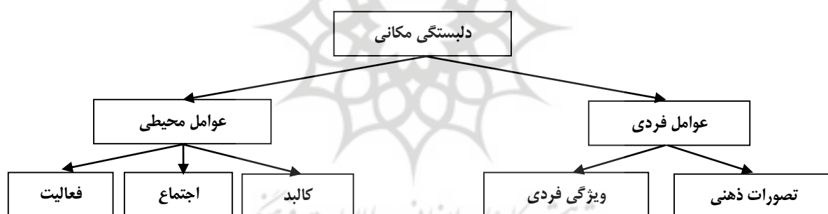
شکل ۱- عوامل موثر بر حس تعلق به مکان

با عنایت به آنچه مذکور افتاد، عوامل تاثیرگذار بر ایجاد حس تعلق به مکان را می‌توان ناشی از فرد و محیط اطراف او (با تمام ویژگی هایش) دانست. از این رو عوامل در یک دسته‌بندی مطابق شکل (۱) به دو گروه عوامل «محیطی» و «عوامل فردی» تقسیم می‌شوند که عوامل محیطی تاثیرگذار از عوامل کالبدی و عوامل اجتماعی می‌باشد که منظور از عوامل کالبدی شاخص‌هایی همچون فرم، روابط و سازماندهی، مکان‌های شاخص و خدمات محلی و همچنین عوامل اجتماعی نیز دربرگیرنده تعاون و همکاری‌های محلی و روایدهای محلی خاطره‌ساز و ... است و عوامل فردی شامل تصورات ذهنی و ویژگی‌های فردی و ... می‌باشد. مانند تصورات ذهنی، رضایت‌مندی، امنیت، رابطه‌ها، توقعات و تعلقات قبلی و ویژگی‌های فردی دارای عوامل شغل، نوع اقامت، فرهنگ مرجع و مدت اقامت است (Ghazizadeh, 2011).