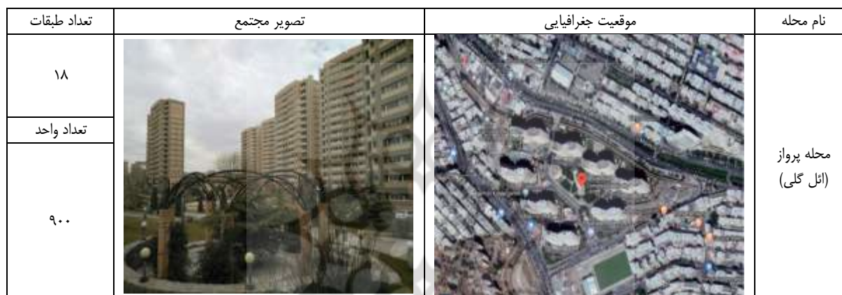
جدول ۲- معرفی نمونه موردی و جامعه آماری

همانطور که در بخش‌های پیشین اشاره شد؛ عوامل محیطی موثر در دلبستگی مکانی شامل سه عامل فرمی- کالبدی، ادراکی- احساسی و عملکردی- فعالیتی می‌باشد که مستخرج از مبانی نظری و مطالعات پیشین است. این عوامل و مولفه‌های مربوطه طبق جدول (۳) قابل ارائه است.