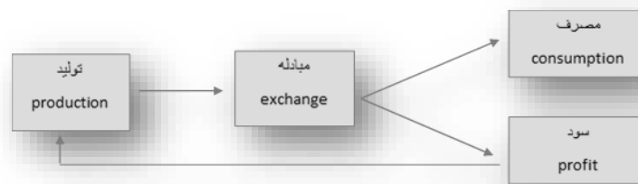
شکل 2. شیوه ساماندهی و فرآیند منافع اقتصادی در نظام سرمایه‌داری جهانی