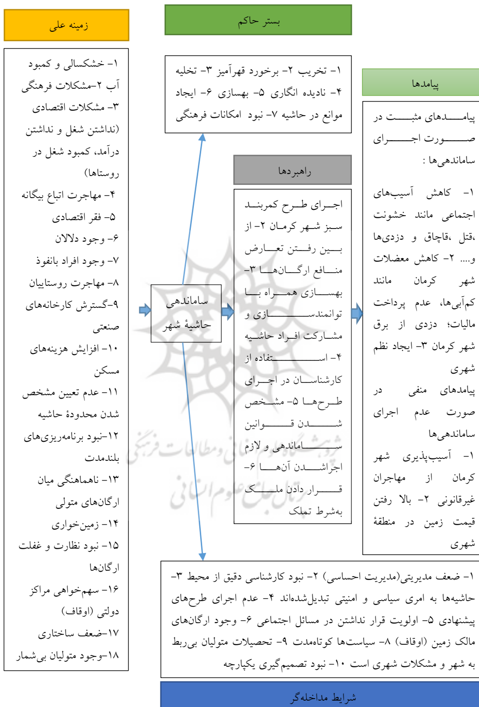
شکل شماره (۱): مدل پارادیمی ساماندهی حاشیه شهر کرمان