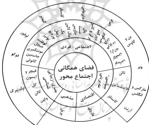
شکل ۱. مدل نظری پژوهش

جغرافیایی را در مدت سه ماه مشاهده و بررسی نمایند. در این سفر آن‌ها در مورد مسائل تربیتی، اخلاقی، فلسفی، اجتماعی و سیاسی، صحبت می‌کنند که بیانگر اندیشه و فکر توسعه‌یافته و ترقی‌خواه نویسنده است. هدف این کتاب آن است که تصویری از اجتماع و شرایط حاکم بر آن زمان، خصوصیات، روابط گروه‌ها، طبقات، اخلاق اجتماعی، سازمان اداری تا حکمت خلقت و طبیعت را در اختیار خواننده قرار بدهد (طالبوف، ۱۳۹۴). بر اساس مبانی نظری فضا‌های همگانی اجتماعی و جستجوی آن‌ها در اندیشه آرمان‌شهری طالبوف مدل نظری پژوهش به شرح شکل ۱ ارائه می‌گردد. این شکل ضمن اینکه نمایانگر ۵ بعد بصری-زیبایی‌شناسی، اجتماعی-فردی، اقتصادی و سیاسی-مدیریتی حاکم بر فضای همگانی است، حاکی از آن است که تئوری‌های هرکدام از نظریه‌پردازها، بیشتر معطوف به کدام‌یک از ابعاد است. بزرگ‌ترین حلقه از دایره بیانگر نظریه‌هایی است که بیش از یک بعد را در بر گرفته‌اند که اکثریت آن‌ها در ابعاد اجتماعی-فردی و سیاسی-مدیریتی، مشترک هستند.