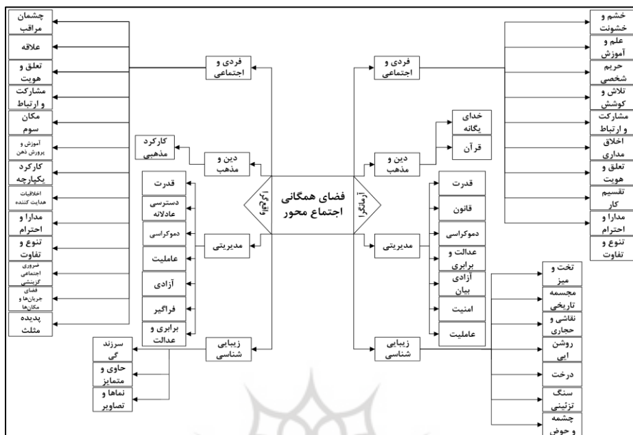
شکل ۳. مقایسه و تطبیق ابعاد و شاخص‌های نظریه‌های مطرح‌شده در حوزه‌های جامعه‌شناسی و