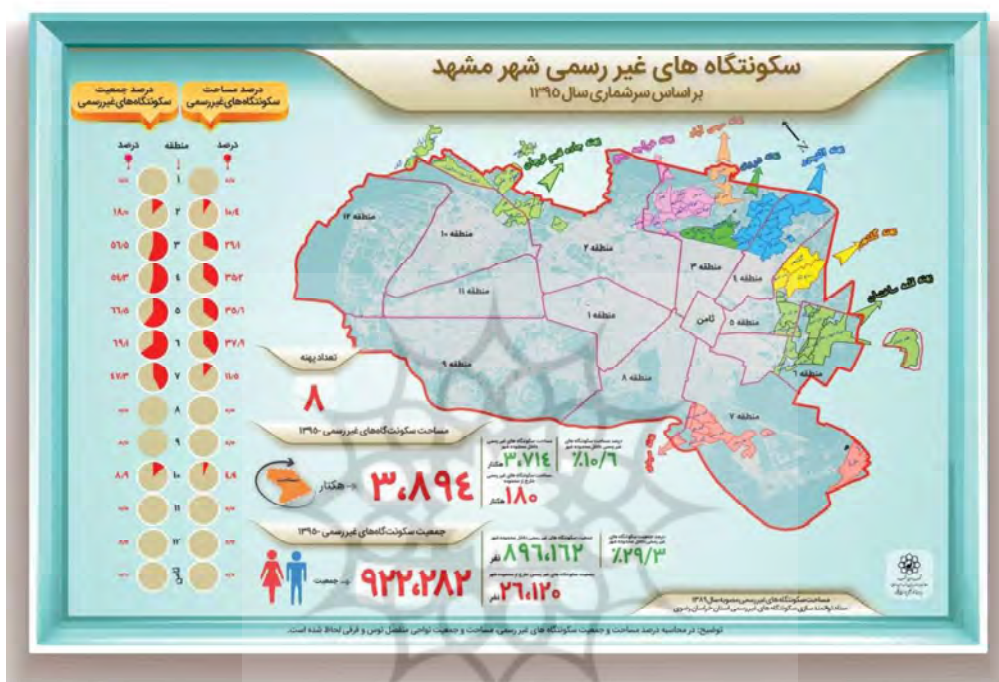
شکل ۱) موقعیت مکانی، مساحت و جمعیت سکونتگاه‌های غیررسمی در شهر مشهد (معاونت برنامه‌ریزی و توسعه سرمایه انسانی شهرداری مشهد، ۱۳۹۵)

حاشیه‌های مشهد سکونت دارند (اخوان عبداللهیان، ۱۳۹۶). درصد مساحت و جمعیت سکونتگاه‌های غیررسمی در شهر مشهد در شکل ۱ مشخص است.