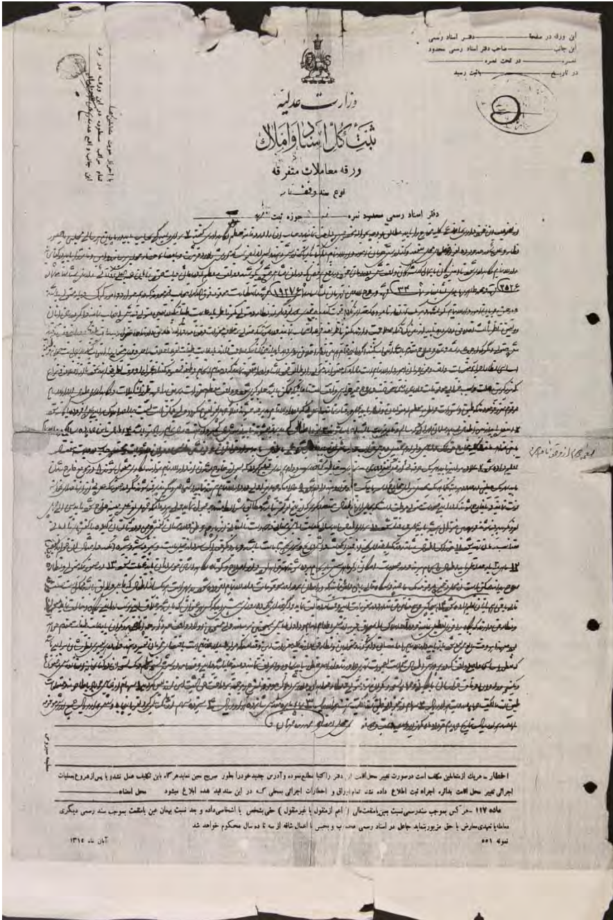
سند شماره ۱- ب