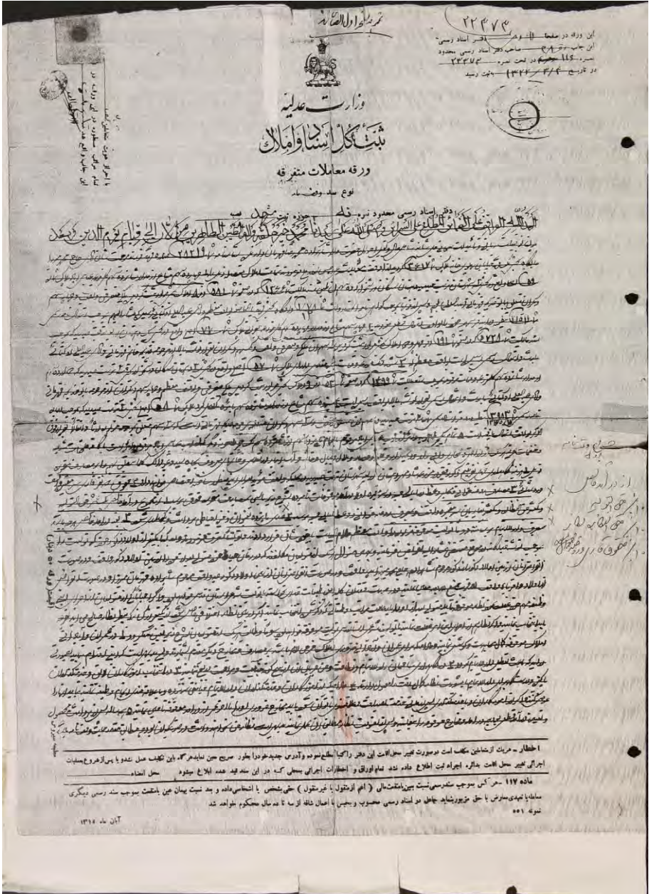
سند شماره ۱- الف