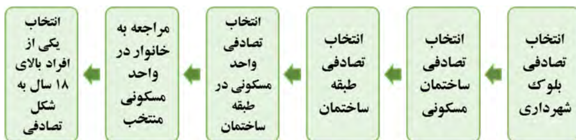
شکل ۲) روش نمونه‌گیری خوشه‌ای چندمرحله‌ای (منبع: نگارندگان)

بررسی روایی پرسش‌نامه از طریق روایی صوری ۱ انجام گرفته است. بدین صورت که پرسش‌نامه در اختیار چند تن از اعضای هیأت علمی دانشگاه فردوسی مشهد قرار گرفته و آنها در چند نوبت آن را اصلاح نمودند. هم‌چنین روایی سازه متغیر سبک تغذیه و سرمایه‌ی فرهنگی با استفاده از تحلیل عاملی سنجیده شد. مقدار KMO در اعتبار سازه برای سبک تغذیه ۰/۹۹۲ و برای سرمایه‌ی فرهنگی ۰/۸۷۳ به دست آمد. پایایی ابزار نیز از طریق آلفای کرونباخ مورد بررسی قرار گرفت که در جدول ۲ نشان داده شده است.