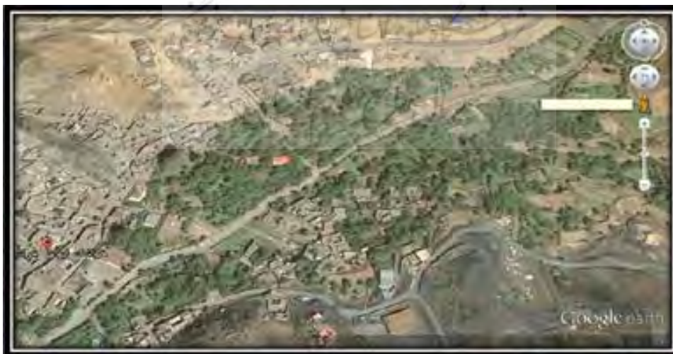
شکل ۱) تصویر ماهواره‌ای روستای خراشاد

روستای خراشاد در موقعیت ۵۹ درجه و ۲۴ دقیقه طول شرقی و ۳۲ درجه و ۴۵ دقیقه عرض جغرافیایی و در ارتفاع ۱۹۸۰ متری از سطح دریا واقع شده است (شکل ۱ و ۲). این روستا دره‌ای است و کوه‌های تاج‌کوه از شرق و آسیاکوه از جنوب شرقی آن را در بر گرفته‌اند. رودخانه فصلی کفکی از کنار روستا می‌گذرد و روستا در دره این رودخانه بر دامنه‌های کوه قرار دارد. باغات و اراضی کشاورزی بر روی بستر و کنار رودخانه گسترش یافته و منازل مسکونی نیز به دلیل فضای کم توسعه بر روی دامنه‌های کوهستان استقرار یافته‌اند. روستای خراشاد از روستاهای معروف شهرستان بیرجند محسوب می‌شود. این شهرت علاوه بر موقعیت جغرافیایی آن و خوش آب و هوایی، به دلیل تجار متمدن، مردم با فرهنگ و پرتلاش آن نیز می‌باشد. این روستا یکی از مرفه‌ترین و توسعه یافته‌ترین آبادی‌های بخش مرکزی و حتی شهرستان بیرجند می‌باشد. تمایل زیادی برای خرید املاک این روستا از سوی ثروتمندان شهری وجود دارد و برخی از ساختمان‌های احداثی در این روستا با گرانترین منازل شهر بیرجند برابری می‌کند (پاپلی یزدی، ۱۳۷۶: ۱۷۲). جمعیت آن در سال ۱۳۹۰، طبق سرشماری مرکز آمار ایران برابر با ۱۴۸ خانوار و معادل ۳۷۹ نفر بوده است که ۱۷۸ نفر مرد و ۲۰۱ نفر زن بودند.