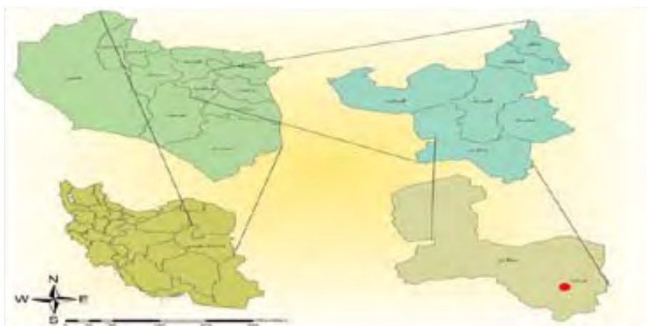
شکل ۲) موقعیت جغرافیایی روستای خراشاد در دهستان باقران، شهرستان بیرجند