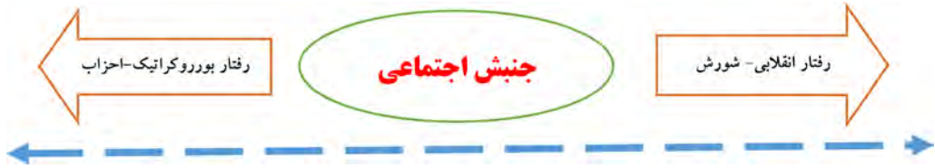
شکل ۱. رابطه جنبش اجتماعی با شورش و رفتار بوروکراتیک

جنبش اجتماعی یک رفتار جمعی است که اعضای آن دارای هویت جمعی و اهداف مشترک هستند، درجه‌ای از استمرار را داراست، فعالیت مداوم اعضا را طلب می‌نماید، نسبتاً سازمان‌یافته است، تقسیم کار اعضا در آن ناشی از جد و جهد اعضا بوده و رنگ داوطلبانه دارد، رهبری جنبش در عمل و آنی ظاهر می‌شود و در عمل نسبت به آن اجماع نسبی ایجاد می‌شود و عموماً محصول تضاد و تخاصم است. برخی از جنبش‌های اجتماعی برای دستیابی به اهداف سازمانی از اینترنت و شبکه‌های اجتماعی (فیس‌بوک، توئیتر، تلگرام و...) استفاده می‌کنند که به آنها "جنبش اجتماعی اینترنتی" گفته می‌شود. در عصر حاضر، به لحاظ استفاده وسیع مردم از اینترنت، امکان تفکیک جنبش اجتماعی اینترنتی و غیراینترنتی ممکن نیست و جنبش‌ها از این ابزار برای افزایش سطح تأثیر استفاده می‌کنند.