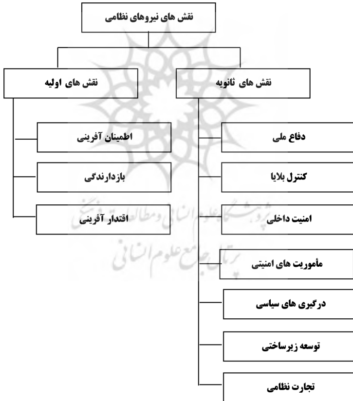
شکل ۱. نقش‌های اولیه و ثانویه نیروهای نظامی

دیگر پروژه‌های زیرساختی استفاده کنند؛ که البته در نبود درگیری، به نظر می‌رسد که این راه خوبی برای تخلیه انرژی نظامیان در یک دوران طولانی رکود فعالیت نظامی است. در بسیاری از موارد، توسعه نیروهای نظامی به ظهور تجارت نظامی به عنوان یک نقش ثانویه جدید برای نظامیان منجر شده است. خدمات هوایی اساسی که توسط هواپیماهای نظامی اجرا می‌شد، به خطوط هوایی تجاری تبدیل شد، شرکت‌های داروسازی مربوط به ارتش که تولیدات آن برای بیمارستان‌های نظامی بود، به شرکت‌های خصوصی متحول شد و نیروهای نظامی ایستگاه‌های رادیویی که برای انتشار تبلیغات سیاسی ایجاد شده بود، برای شهروندانی غیرنظامی مورد بهره‌برداری قرار می‌گرفت و درآمدهای آن نیز حاصل از تبلیغات تجاری رادیویی بود. در شکل ۱ نقش‌های اولیه و ثانویه نیروهای نظامی قبل ترسیم شده است.