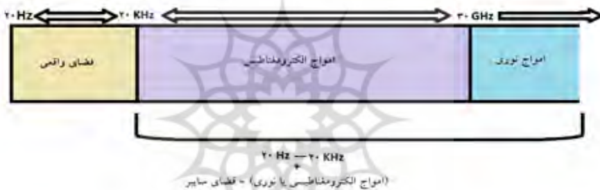
شکل ۱. شکل‌گیری فضای سایبری

از هر کدام از این طیف‌ها برای عملکرد پخش و انتشار ۲ خاصی استفاده می‌گردد؛ به عنوان مثال، امواج فرکانس‌های بالا ۳ برای پخش و انتشار دور بُرد استفاده می‌شود؛ به طوری که این طیف به لایه یونسفر زمین تابیده شده و بازتابش آن در نقطه دیگری از زمین به دست می‌آید. امواج خیلی بالا ۴ در انتشار آنتن به آنتن و مستقیم استفاده می‌گردد و امواج مافوق