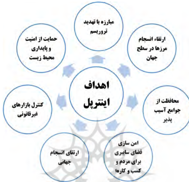
شکل ۱. اهداف سازمان اینترپل (گزارش سازمان اینترپل ۲۰۱۷)

۲. تأسیس و توسعه کلیه مؤسسه‌هایی که جهت پیشگیری از وقوع جرایم عمومی ضروری است.