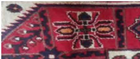
شکل ۵. آرسین در متن قالی