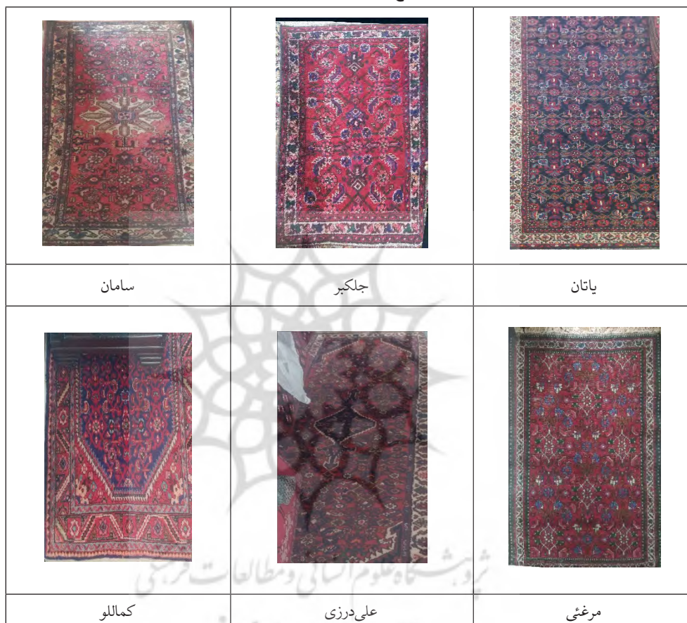
جدول ۲. طرح بالوق در روستاهای نوبران.

چشمه‌ای روان است و از بالادست سرزیر و به برکه‌ای محصور در میان دوکوه می‌ریزد. این برکه پر از ماهی است؛ اما مردم این روستا و روستاهای اطراف به هیچ عنوان آن‌ها را صید نمی‌کنند و تنها از آب برکه برای کشاورزی استفاده می‌کنند. پرهیز از صید ماهیان در اعتقادات مردم این منطقه ریشه دارد. آن‌ها بر این باورند که این ماهی‌ها نظرکرده هستند.