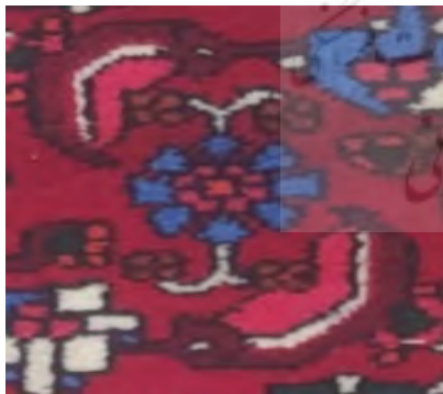
شکل ۱. نقش ماهی بالوق