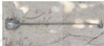
شکل ۲. آرسین