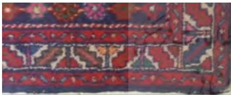
شکل ۳. آرسین شرفه

حاشیه‌های متداول در فرش‌های منطقه نوبران و روستای سامان است. «آرسین» وسیله فلزی است که یک سر آن به شکل کاردک و سر دیگر به صورت چنگک است و برای خارج کردن نان از تنور است (شکل ۲). این واژه احتمالاً از کلمه «آسین» است که در زبان پهلوی به معنی آهن است که در گویش مردم همدان «آرسین» گفته می‌شود (غفاری، ۱۳۹۱: ۲۳۱). این نقش مایه هرگاه به عنوان حاشیه، مورد استفاده قرار گیرد و در میان دو نقش مایه پلکانی باشد، در میان روستاییان به «آرسین شرفه» مشهور است (شکل ۳). نام دیگر حاشیه آرسین در منابع مکتوب «دیرناخ» است. انواع دیگر حاشیه دیرناخ که در زبان ترکی به معنای ناخن است، در مناطق قفقاز با عنوان حاشیه برگ و جام شناخته می‌شود و حاشیه اصلی قالی‌های شاهسونی بغدادی به شمار می‌آید (عسگری، ۱۳۹۷) (شکل ۴). این نقش مایه در متن قالی به صورت تک یا صلیب مانند، دیده می‌شود. مصاحبه با بافندگان روستایی نشان می‌دهد (شکل ۵) مجابی و فنایی (۱۳۹۵) می‌نویسند: «این حاشیه در قالی مزلقان، حاشیه دوست‌کامی نامیده می‌شود که از حاشیه‌های معروف فرش ایران است و در فرش‌های قشقایی و قفقازی دیده می‌شود. ریشه این نقش مایه، حاشیه به آیین مهرپرستی و جام دوست‌کامی بازمی‌گردد که مرشدان و نوگرویدگان به مهرپرستی آن را دست‌به‌دست کرده و طبق رتبه و مقام، همچنین خطوط هفت‌گانه آن نوشیده می‌شد. ساختار ظاهری این نقش مایه، جام شرابی است که در دو طرف آن دو برگ پلکانی یا اره‌ای قرار گرفته است» (به نقل از حصوری، ۱۳۸۱: ۴۷).