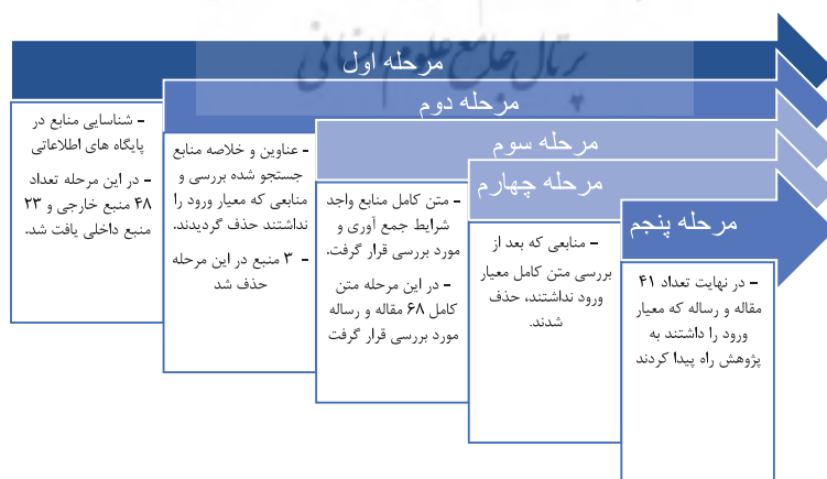
شکل ۱. مراحل نمونه‌گیری هدفمند اسناد الکترونیکی

برای نیل به اهداف این پژوهش، از تحلیل محتوای کیفی استفاده گردید. جامعه آماری، کلیه رساله‌های دکتری و مقالات علمی پژوهشی داخلی و خارجی در حوزه موک بودند که در سایت‌های ایراندک، گیگالیب، مگیزان، اس‌آی‌دی، اسپرینگر و ساینس دارکت در بین سال‌های ۲۰۱۷ تا ۲۰۲۲ میلادی و یا ۱۳۹۶ تا ۱۴۰۰ هجری شمسی نمایه شده بودند و یا از طریق موتور جستجوی گوگل اسکالر دسترسی به آنها فراهم می‌شد. نمونه آماری، ابتدا شامل ۶ رساله دکتری و ۴۲ مقاله خارجی به زبان انگلیسی و ۵ رساله دکتری و ۱۸ مقاله داخلی، در مجموع ۷۱ پژوهش داخلی و خارجی بودند که به روش نمونه‌گیری هدفمند انتخاب شدند. نحوه انتخاب نمونه‌های آماری بدین صورت بود که پس از شناسایی منابع مورد نظر در پایگاه‌های اطلاعاتی تعداد ۴۸ منبع خارجی و ۲۳ منبع داخلی یافت شد. سپس عناوین و خلاصه منابع جستجو شده بررسی و منابعی که معیار ورود را نداشتند حذف گردیدند که در این مرحله نیز ۳ منبع حذف شد. در مرحله سوم متن کامل منابع واجد شرایط جمع‌آوری و مورد بررسی قرار گرفت که در این مرحله بعد از بررسی متن کامل معیار ورود را نداشتند، حذف شدند. در پایان تعداد ۴۱ مقاله و رساله به تحقیق راه پیدا کردند. مراحل مختلف انتخاب هدفمند منابع را در شکل ۱ می‌توان دید.