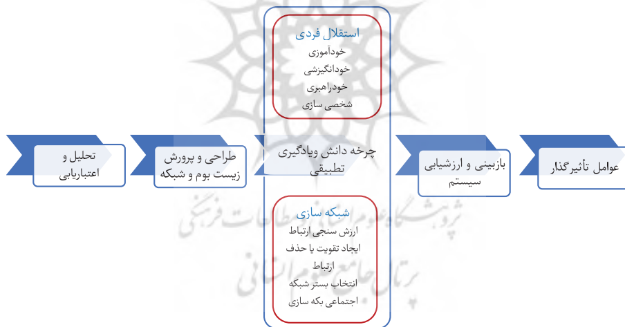
شکل ۲. جایگاه مؤلفه‌های محیط یادگیری شخصی شده در دوره‌های برخط آموزشی مهندسی در الگوی زیمنس

پس بهتر است ابتدا برنامه یادگیری خود را بر حسب زمان و شرایط خود، تنظیم و شخصی سازی کند، سپس با انتخاب شبکه اجتماعی مناسب این فنون را بکار گرفته و با منابع مختلف ارتباط برقرار کند. پس از ایجاد ارتباط، یادگیرنده باید گره‌ها یا عناصر مشاهده شده در شبکه‌ها را ارزش سنجی کرده و در صورت مفید بودن، ارتباط را حفظ و در صورت لزوم تقویت کند و در غیر اینصورت آن گره یا عنصر را از شبکه ارتباطی خود خارج کند. به عنوان مثال در طراحی زیست بوم به یادگیرنده امکان جستجو و تعامل، برای یافتن منابع بیشتر مرتبط با موضوع قرار داده می‌شود، اما این شخص یادگیرنده است که باید از میان تمام منابع، گره‌ها و عناصر مفید را انتخاب و در پوشه کاری خود به عنوان شبکه دانش شخصی خود ذخیره نماید و از آن به عنوان محتوای دانش برای یادگیری عمیق و خودشکوفایی بهره ببرد. این عملیات‌ها، از جمله مواردی است که در خصوصیات شبکه‌ای سیموک‌ها وجود دارد و وجه تمایز هیبریدموک‌ها با موک‌های رایج است که در واقع ایکسموک هستند. در شکل شماره ۲، جایگاه مؤلفه‌های محیط یادگیری شخصی شده در دوره‌های برخط مهندسی در الگوی زیمنس نشان داده شده است.