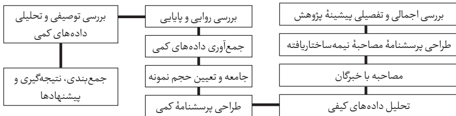
شکل ۲. روند انجام پژوهش حاضر

در شکل ۲، روند انجام پژوهش آورده شده است.