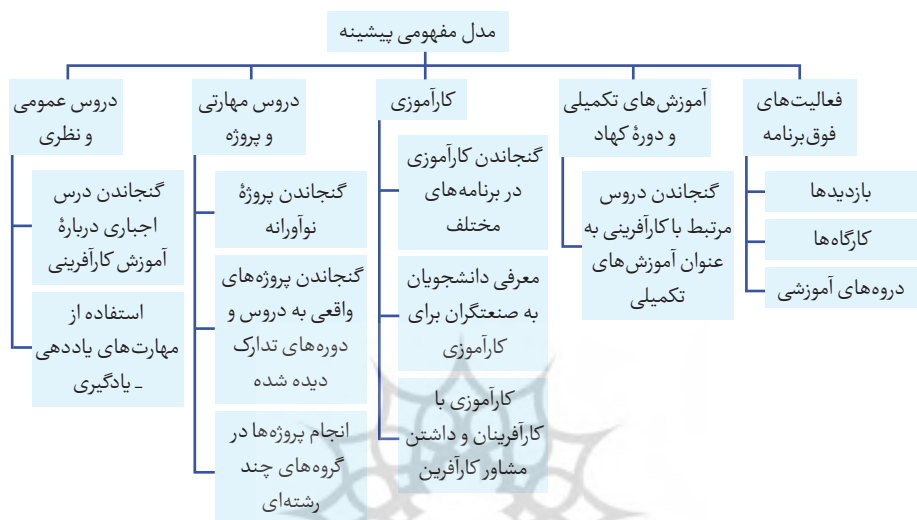
شکل ۱. مدل مفهومی ابتدایی چارچوب تقویت مهارت‌های کارآفرینی در برنامه درسی کارشناسی مهندسی عمران

بر اساس هدف پژوهش حاضر (چارچوب ارتقای محتوای آموزش کارشناسی مهندسی عمران، با رویکرد انتقال مهارت‌های کارآفرینی) و متغیرهای به دست آمده از پیشینه، مدل شکل ۱ تدوین شده است.