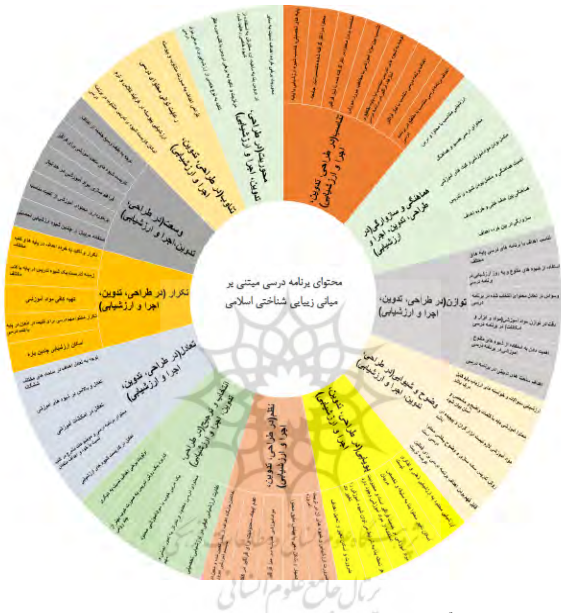
شکل ۳. برنامه درسی مبتنی بر آیات و روایات در مدل خورشیدی

در نهایت، بر اساس خروجی PLS می توان برنامه درسی مبتنی بر آیات و روایات را در مدل خورشیدی در شکل فوق مشاهده نمود.