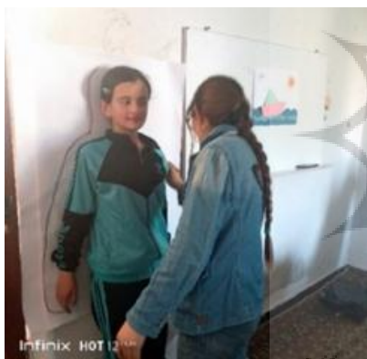
تصویر ۲. کودکان در تمرین شناسایی واکنش های بدنی به اضطراب

در بخش آموزش روانشناختی جلسات، تمرکز بر آموزش کودکان برای شناسایی واکنش های بدنی به اضطراب (تصویر ۲)، صحبت کردن درباره ترس هایشان، همراه با تمرینات آرامش و تکنیک های مواجهه خیالی با استفاده از کارت های رنگی مذکور در برنامه درمانی بود. این کارت ها در بخش دوم جلسات مورد استفاده قرار می گرفتند که بر درمان مواجهه خیالی تمرکز داشتند و به کودکان اجازه می دادند به رویدادهای مربوط به جنگی که شاهد یا شنیده بودند و به طور عمیق در خاطرات آنها نقش بسته بود، پرداخته و آنها را تصویر کنند. این فرآیند شامل نقاشی مکان ها و یا افراد خاصی بود که آنها را از دست داده اند. در نهایت، جلسات با حضور