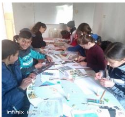
تصویر ۱. گروه کودکان سوری در حین شرکت در جلسات هنر درمانی

آسان برای کودکان فراهم شود و پیوستگی جلسات حفظ شود. یک کودک پس از جلسه اول انصراف داد و کودک دیگری جایگزین شد. به طور کلی، تعهد به جلسات درمانی و مشارکت در فعالیت های هنری خوب بود (تصویر ۱).