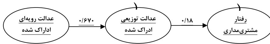
تصویر ۲: مدل مفهومی بازنگری شده و نهایی از رابطه بین ادراکات عدالت و رفتار مشتری‌مداری در پرستاران

پرستاران و جایگاه و موقعیت سازمانی آنها در بیمارستان‌های دولتی ایجاب می‌کند که توسط افراد ارشد و احیاناً سرپرست به صورت دوره‌ای تحت ارزیابی عملکرد قرار گیرند. این ارزیابی عملکرد به هر شکلی که انجام شود مبنای تصمیم‌گیری برای پاداش، ارتقاء و احیاناً اضافه حقوق و امتثال آن است. حتی از این منظر نیز عایدات پرستاران به طور جدی تحت تأثیر ادراک آنها از حضور یا عدم حضور عدل و انصاف در تمامی مراحل تصمیم‌گیری، ابلاغ و اجرای تصمیمات است. بدین ترتیب رابطه بین عدالت توزیعی و رویه‌ای و از طرف دیگر تأثیر غیرمستقیم عدالت رویه‌ای بر مشتری‌مداری از طریق عدالت توزیعی به صورت منطقی قابل تبیین است. البته کیم و همکاران [۳] که در پرستاران کره‌ای نتایجی مشابه با نتیجه پژوهش حاضر بدست آورده‌اند، معتقدند که عدم تأثیر مستقیم عدالت رویه‌ای بر مشتری‌مداری به ویژه در کره و آسیا تحت تأثیر فرهنگ جمع‌گرایی و فاصله قدرت است. ولی به نظر پژوهشگران پژوهش حاضر، برخلاف نظر کیم و همکاران [۳] تأثیر مستقیم عدالت توزیعی ادراک شده بر مشتری‌مداری خود حاکی از آن است که در رفتار مشتری‌مداری، پرستاران در قالب هویت جمعی و گروهی عمل نمی‌کنند، بلکه در درجه نخست تحت تأثیر هویت فردی است که عمل می‌نمایند. این امر از بسیاری جهات قابل تبیین است. در درجه اول هر فرد قبل از اینکه عضوی از یک گروه باشد یک شخص با مجموعه ویژگی‌های خاص و منحصر به فرد است. در کنار این امر وقتی افراد احساس نمایند که از نظر سازمان محل کار خود ارزشمند تلقی می‌شوند، چون در تخصیص پیامدهای مادی و غیرمادی برای آنها عدل و انصاف رعایت شده، هویت فردی و سپس تعلق و احترام و پیوستگی آنها بالا می‌رود. [۲] از طرف دیگر وقتی ادراک پرستاران از رویه‌های تصمیم‌گیری منصفانه