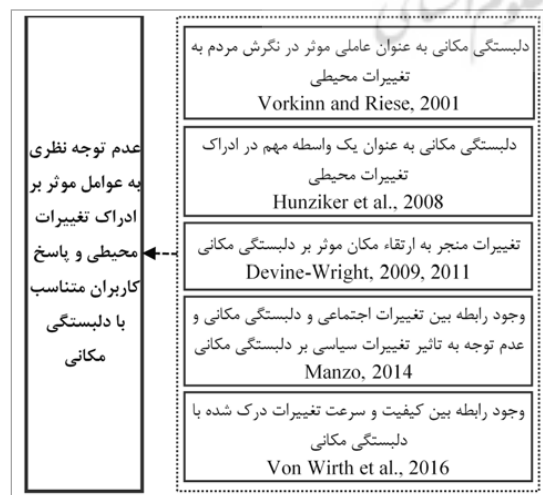
تصویر ۱. نتایج مطالعات تغییرات محیطی و دل‌بستگی مکانی (نگارندگان)

با توجه به اهمیت تأثیر تغییرات محیطی به‌عنوان پدیده بیرون از فرد بر دل‌بستگی مکانی، پژوهشی که به صورت نظری (با توجه به داده‌های در دسترس) به ارائه نحوه ارتباط ادراک تغییرات محیطی با دل‌بستگی مکانی و در پی آن پاسخ به تغییرات بپردازد، وجود ندارد. علاوه بر موضوع مذکور در بیشتر پژوهش‌های مرتبط با دل‌بستگی مکانی، از روشی کمی برای سنجش آن متناسب با عوامل مؤثر بر دل‌بستگی (به‌خصوص عوامل فردی) استفاده شده است. در حالت مذکور تنها به میزان تأثیر عوامل مؤثر بر دل‌بستگی مکانی پی برده شده و به تعریف مؤلفه‌های جدید و بسط نظریه دل‌بستگی مکانی