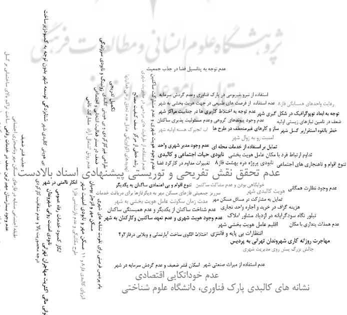
تصویر ۳- ابر کدی عوامل مؤثر بر هویت شهر پردیس از نگاه کادر مدیریت شهری