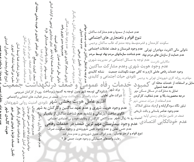
تصویر ۲- ابر کدی عوامل مؤثر بر هویت شهر پردیس از نگاه شهروندان

*مقبره نورالشهدا و سایر نشانه‌های شهری: این مقبره مکانی مذهبی است که از همه شمولی برخوردار نبوده و تنها مربوط اقتصار مذهبی شهر می‌باشد. در گفت‌وگو با مدیریت شهری علاوه بر ذکر مقبره نورالشهدا به‌عنوان نشانه‌های شهری، از بام پردیس (که زمانی در دست احداث بوده و متوقف شد) را دارای پتانسیل هویتی ذکر کردند. در ابر کدی که در زیر آورده شده است تاکید بر مفاهیم، با جلوه‌ای بصری از بیشتر به کمتر ارائه شده است.