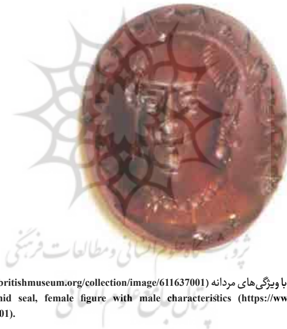
تصویر ۱: مهر ساسانی با نقش مایه زن با ویژگی‌های مردانه (https://www.britishmuseum.org/collection/image/611637001). Fig. 1: Sassanid seal, female figure with male characteristics (https://www.britishmuseum.org/collection/image/611637001).

زن در هنر ساسانی بیشتر در شخصیت ملکه جلوه‌گر شده است. تصویرگری زن به عنوان ملکه با پیروی از اصول به‌کار رفته در تصویرگری شاهان و درباریان ساسانی است؛ به طوری که گیسوان بافته‌شده زنان آنان را از مردان متمایز می‌کند و اگر این ویژگی، یعنی موهای بافته‌شده نبودند، تشخیص تصویر آن‌ها از مردان دشوار بود (هرتسفلد، ۱۳۸۱: ۲۲۱)؛ از جمله ویژگی‌های مردانه در تصویر زنان ساسانی، گردن کلفت آن‌ها است که مانند مردان به تصویر کشیده شده است (تصویر ۱).