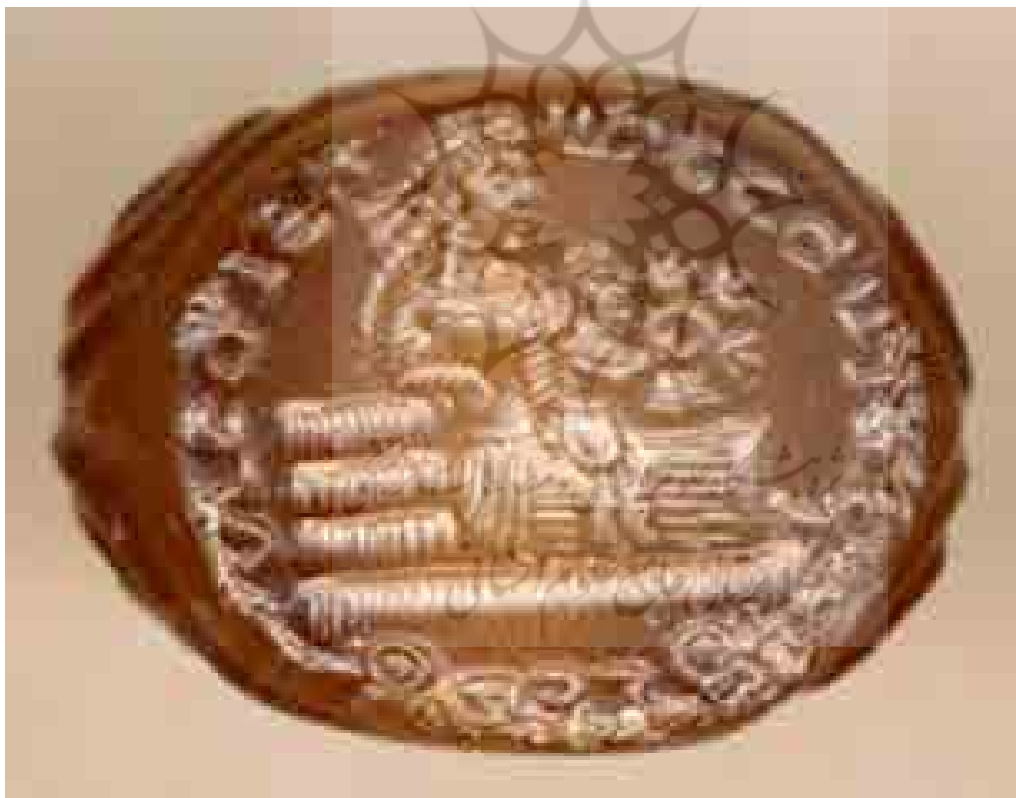
تصویر ۵: نقش زن و کودک بر مهری ساسانی ( https://www.britishmuseum.org/collection/object/A_1880-3503_1 ). Fig. 5: The motif of woman and child on Sassanid Mehri ( https://www.britishmuseum.org/collection/object/A_1880-3503_1 ).