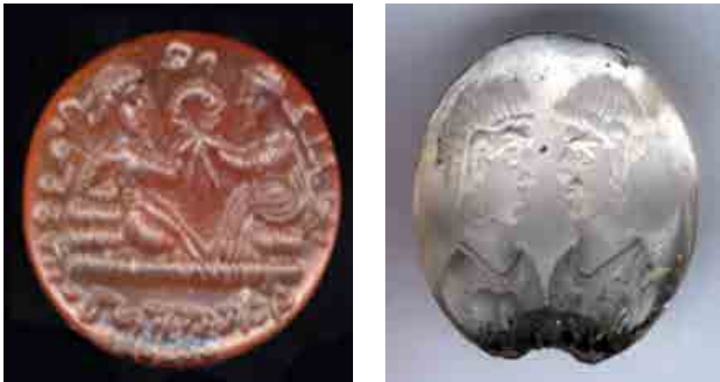
تصویر ۳: تصویر ملکه در کنار پادشاه در مهری ساسانی (https://www.britishmuseum.org/collection/object/A_1880-3501&1533164001)