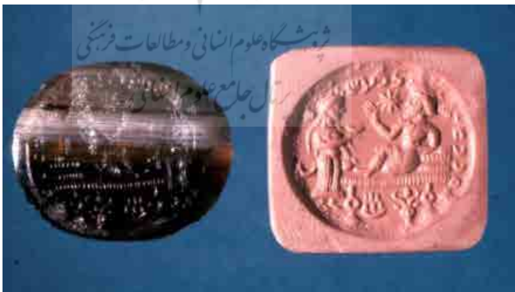
تصویر ۴: نقش زن و مرد بر مهر ساسانی با مفهوم ازدواج (https://www.britishmuseum.org/collection/image/425635001). Fig. 4: The motifs of men and women in Sassanid era with the concept of marriage (https://www.britishmuseum.org/collection/image/425635001).

نقش زن در کنار نقش مرد نشانگر مفهوم ازدواج نیز بوده است. در برخی از این تصاویر صحنه اهدای گل، حلقه روبان دار و ستاره شش ضلعی تحت عناوین پیمان ازدواج تفسیر شده‌اند (تصویر ۴). تصویر زن کنار مرد هم‌چنین در سکه‌های ساسانی، از جمله سکه بهرام دوم نیز دیده می‌شود که این نشان از روابط خانوادگی و اهمیت آن در دوره ساسانی دارد (گیرشمن، ۱۳۷۴: ۲۴۱).