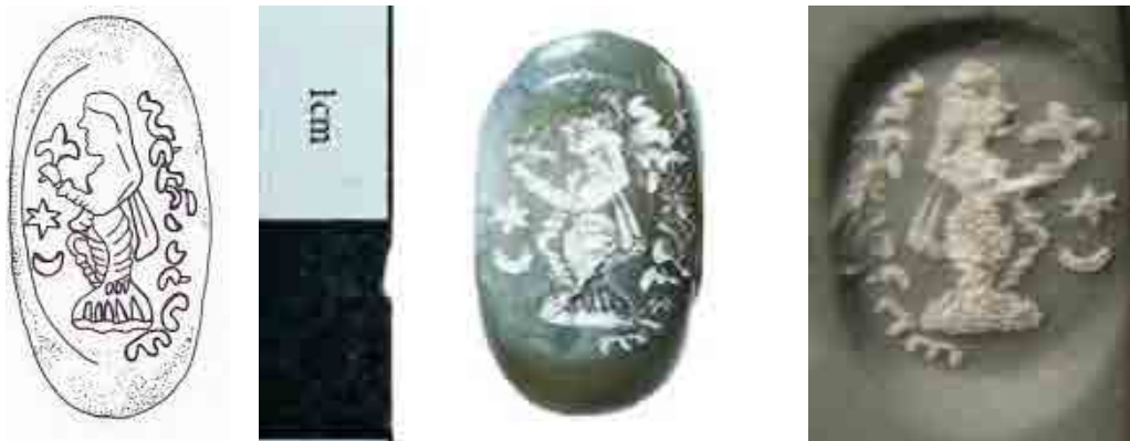
تصویر ۶: مهر موزه آرامگاه بوعلی سینا با نقش زن، همدان. Fig. 6: Bu-Ali Sina Museum seal with a woman motif.

نسبت است (46: 1979: Gignoux). با توجه به نظریه فرای و گوبل و با تمرکز بر خط فارسی میانه و ریخت‌شناسی مهرها (46: 1973: Frye؛ گوبل، ۱۳۸۴: ۳۶)، می‌توان تاریخ این مهر را متعلق به اواخر دوره ساسانی دانست.