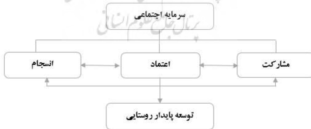
شکل ۱. مدل نظری پژوهش

اعتماد، هسته مرکزی بسیاری از مفاهیم کاربردی موجود در تئوری‌های علوم اجتماعی است که برای تبیین فرایندهای زندگی روزمره از جمله رضایت از زندگی، رونق اقتصادی، آموزش، رفاه، مشارکت، جامعه مدنی، دموکراسی، مردم سالاری و غیره به کار گرفته می‌شود (Delhey, Newton, & Welzel, 2011). در بررسی ادبیات جامعه‌شناختی مفهوم اعتماد به سه رهیافت فکری وجود دارد: اعتماد به منزله ویژگی فردی افراد، اعتماد به منزله عاملی در ارتباطات اجتماعی و نهایتاً هم اعتماد به عنوان ویژگی نظام اجتماعی با تأکید بر رفتار مبنی بر تعاملات و سوگیری‌ها در سطح فردی، مفهوم‌سازی شده است (Misztal, 2001). با عنایت به مفهوم سرمایه اجتماعی و ابعاد سه گانه آن مدل مفهومی تحقیق به شکل زیر ارائه می‌گردد.