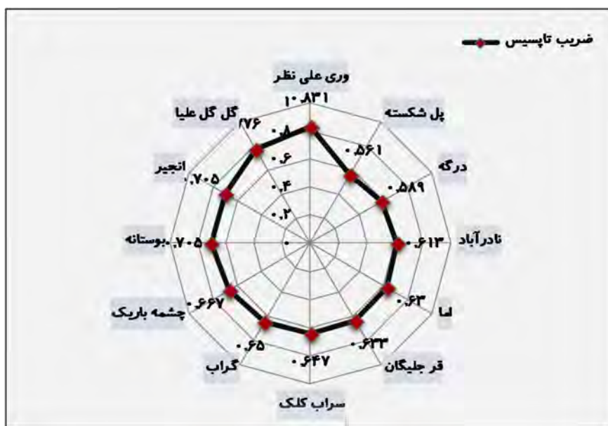
شکل ۱۰. رتبه‌بندی نهایی روستاهای شهرستان ملکشاهی