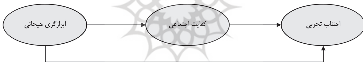
شکل ۱) مدل مفهومی پیشنهادی پژوهش

آنها از موقعیت‌های اجتماعی که برای آنها اضطراب و شرم را در پی دارند، فراری هستند. همچنین پژوهش‌های دیگر نشان داده است ابرازگری هیجانی از محیط اطراف تأثیر پذیرفته و بر جایگاه و موقعیت اجتماعی فرد نیز تأثیر می‌گذارد؛ به طوری که برودهل، فینست، استوری و پدرسون ۱ (۱۵) پژوهشی بیان داشتند ابرازگری هیجانی از عوامل مؤثر بر میزان روابط اجتماعی و کفایت اجتماعی است، به طوری که افراد با ابرازگری هیجانی قوی توانایی برقراری روابط اجتماعی بیشتری داشته که باعث حضور مؤثر در جامعه و تقویت مهارت‌های کفایت اجتماعی می‌شود. همچنین پولیو، کارنر و باست ۲ (۱۶) ابراز صمیمیت و ابراز هیجان‌ات مثبت بر ایجاد روابط اجتماعی مؤثر بوده و جلوه اجتماعی مثبتی به فرد اعطا می‌کند و همین امر کفایت اجتماعی که در بردارند روابط اجتماعی مثبت و انجام وظایف اجتماعی با کارایی بالا است را نیز افزایش می‌دهد. اختلالات اضطرابی تأثیر منفی قابل توجهی بر کیفیت زندگی دارند و شایع‌ترین نوع آنها اضطراب فراگیر است که