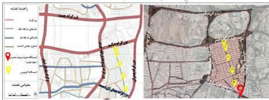
شکل (۴). نقشه مسیر دسترسی عمومی محدوده کوی نصر

شاخص دسترسی به مراکز حمل‌ونقل عمومی با بار عاملی ۰.۷۵۱ در عامل اقتصاد زمین و توزیع فعالیتی اثرگذار است. نقشه زیر مسیر دسترسی‌های مترو و اتوبوس محدوده کوی نصر را نشان می‌دهد. وجود ایستگاه‌های مترو و ایستگاه اتوبوس در کوی نصر و اطراف آن نشان از وضعیت مطلوب دسترسی در محدوده دارد. این شاخص با شاخص‌های قیمت مسکونی و تجاری در ارتباط است. به گونه‌ای که بهبود دسترسی و حمل‌ونقل عمومی در این محدوده می‌تواند سبب افزایش سفرها، افزایش حضور پذیری مردم و در نهایت عاملی تأثیرگذار در قیمت تجاری و مسکونی در این محله و توجیه‌پذیری افزایش فعالیت‌های اقتصادی و تغییر کاربری‌ها باشد.