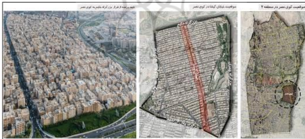
شکل (۱). نقشه معرفی محدوده خیابان گیشا

ساختار اصلی منظم و شطرنجی محله کوی نصر واقع در منطقه دو شهرداری تهران بر اساس خیابان گیشا شکل گرفته و غالب کاربری‌های تجاری محلی و فرامحلی در حاشیه این خیابان مکان یافته‌اند. خصلت تجاری غالب در این محور ۱۶۰۰ متری باعث شده که حضور مردم با فراغت و تفریح نیز همراه باشد و از این لحاظ خیابان گیشا نقشی فرامحله‌ای یابد. وجود کاربری‌های جاذب سفر در سطح منطقه و فرامنطقه (مجموعه برج میلاد، بوستان گفتگو، محل دائمی نمایشگاه‌های بین‌المللی شهرداری تهران و مرکز خرید گیشا) در نزدیکی این خیابان، سبب تمایز ساختار کالبدی و عملکردی آن شده است (آزادی و دیگران؛ ۱۳۹۶). شکل (۱) موقعیت خیابان گیشا را نشان می‌دهد.