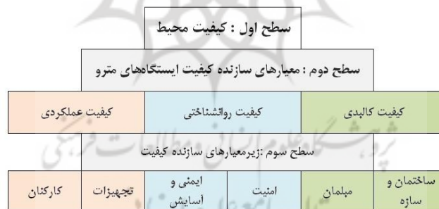
شکل (۲). مدل تجربی کیفیت محیطی ایستگاه‌های مترو

جهت دستیابی به اطلاعات ابتدا اسناد و مدارک، آمار و اطلاعات، متون فارسی، لاتین و ... از طریق مراجعه به کتابخانه، استفاده از نشریات تخصصی، منابع اینترنتی گردآوری شد. مدل تجربی سنجش کیفیت محیط دارای ساختاری سلسله‌مراتبی بوده و متشکل از معیارها و جزمعیارهایی است که در سطوح مختلف آن قرار می‌گیرند. در این جزمعیارهای سطح آخر مدل، مبنای تنظیم پرسشنامه تحقیق قرار گرفته و براساس میزان رضایتمندی یا نارضایتی ساکنین محیط موردنظر امتیازدهی می‌شوند. معیارهای اصلی جهت سنجش در سه دسته شامل معیارهای کالبدی و عملکردی و روان‌شناختی قرار گرفته که سطح دوم از معیارها را تشکیل می‌دهند. معیارها با استفاده از میزان رضایتمندی افراد و با استفاده از مدل‌های تحقیقات مشابه به‌دست آمده‌اند.