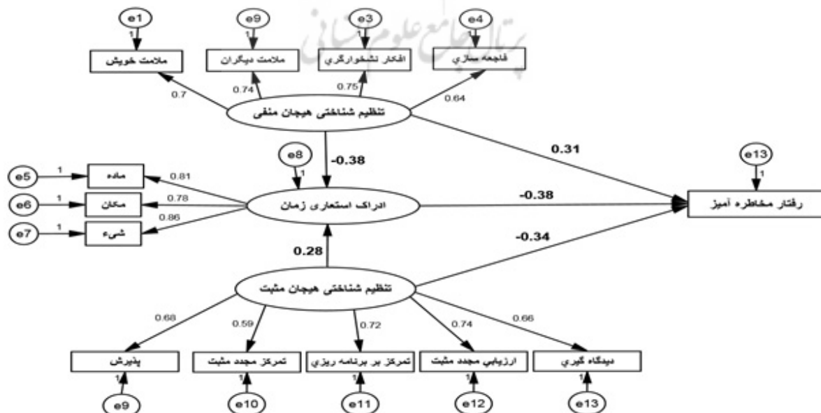
شکل ۱. مدل رابطه بین راهبردهای تنظیم شناختی هیجان با رفتار پرخطر نوجوانان با نقش میانجی ادراک استعاری زمان