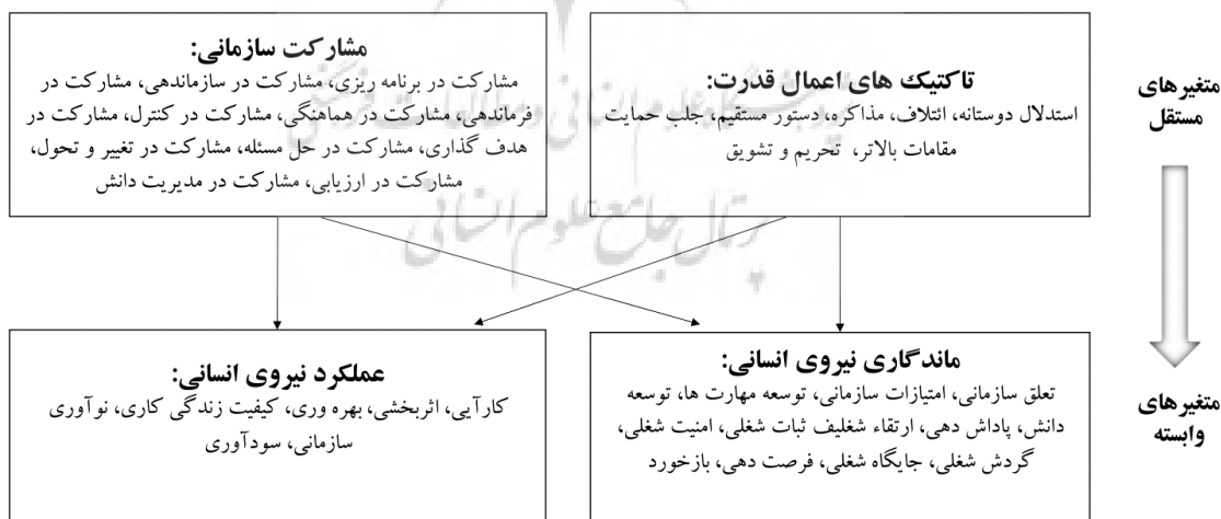
شکل ۱: مدل مفهومی پژوهش

رنجبر و شفیع (۱۳۹۴) در تحقیقی یکی از عوامل موثر بر بقاء و ماندگاری کارکنان شهرداری منطقه ۱۳ تهران را مدیریت مشارکتی ذکر کرده اند. وفایی نژاد و همکاران (۱۳۹۲) یکی از عوامل موثر بر بقا و ماندگاری (حفظ و نگهداری) کارکنان ستادی معاونت توسعه مدیریت و منابع دانشگاه علوم پزشکی و خدمات بهداشتی، درمانی مازندران را مشارکت سازمانی کارکنان ذکر کرده اند. طبق نظر قاضی زاده و امانی (۱۳۹۱)، مشارکت سازمانی کارکنان یک عامل داخلی مؤثر بر ماندگاری نیروی انسانی می باشد. ایتو و بریتج (۲۰۱۵) در تحقیق میدانی که بر روی ۶۰۰ نفر از کارکنان تمام وقت شرکت خدمات فدرال کانادا انجام داده اند بر این نکته تأکید دارند که سازمان ها جهت کاهش تمایل به ترک خدمت، ضرورت دارد تا برنامه های انگیزشی مانند مشارکت کارکنان نخبه در تصمیم گیری، استقلال کاری و حمایت مدیریتی را اجراء نمایند. باقری مجد و همکاران (۱۳۹۴) به این نتیجه رسیدند که مشارکت سازمانی در تقویت سرمایه انسانی سازمان نقش تعیین کننده دارد، نتایج تحقیق حاجی کریمی و منصوریان (۱۳۹۱) نشان داده است مدیریت دانش در بهبود عملکرد سازمانی تاثیر معنی داری دارد، رایس (۲۰۱۹) در پژوهشی با عنوان تأثیر مشارکت در پذیرش و تحولات فنی با ایجاد زمینه مشارکت فعال کارکنان در ایجاد تغییرات ساختاری و فنی و با تأکید بر همکاری و تشریک مساعی کارکنان ثابت نموده که مشارکت می تواند علاوه بر افزایش تولید و بهبود کیفیت کالا، در تقویت عملکرد نیروی انسانی نقش داشته باشد. و مطالعه یانگ و همکاران (۲۰۱۵) نشان داد یک رابطه مثبت بین بهبود مدیریت دانش و عملکرد سازمانی وجود دارد.