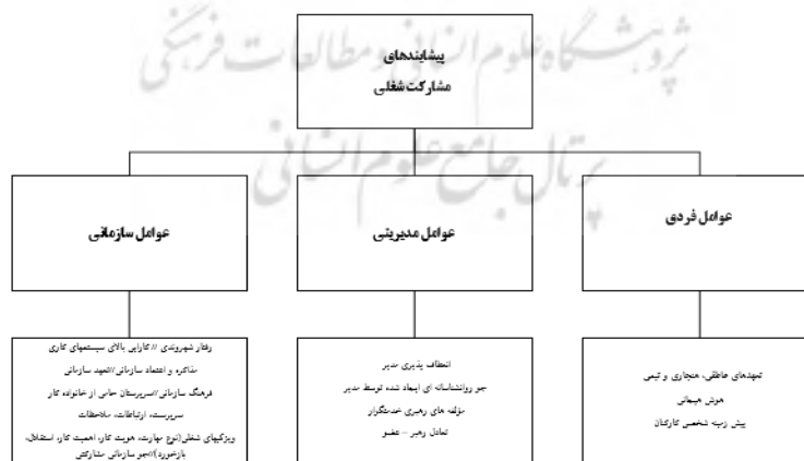
شکل (۳) مدل مفهومی استخراجی از روش فراترکیب

بر اساس مطالعات پیشین و طبقه بندی کدهای استخراج شده در جدول (۴) مدل مفهومی پیشنهادی پژوهش را که از فرایند فراترکیب به دست آمده، نشان می دهد. مدل مفهومی اولیه تحقیق، متشکل از ۳ مقوله، (عوامل فردی، عوامل مدیریتی و عوامل سازمانی) و ۱۸ مفاهیم است. با توجه به اینکه در پژوهش حاضر برای مدل سازی از روش اکتشافی فراترکیب استفاده شده است. حال از ترکیب چارچوب و نظریه های اشاره شده، مدل مفهومی پیشنهادی پژوهش به صورت شماتیک در شکل (۳) ارائه شده است.