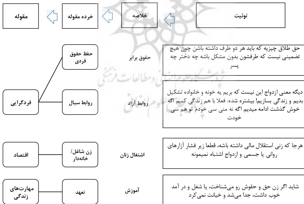
شکل ۱- نمونه‌ای از انجام تحلیل محتوای کیفی با رویکرد استقرایی

سه دسته به شرح زیر تعریف شد تا با ماشین لرنینگ، عمل پاک‌سازی صورت پذیرد: ۱- کاراکترهای نامفهوم مانند HTML code - meta data - markup، کدهای غیر متنی و... ۲- هرزنامه‌ها، لینک‌ها، توئیت‌های زیر پنج کلمه، کلمات نامفهوم، کلمات تکراری و... ۳- متون و محتوای فاقد ارزش بررسی و یا فاقد بار معنایی برای تحلیل پس از پاک‌سازی مرحله اول، تک‌تک توئیت‌ها خوانده شد و آنهایی که مناسب تحلیل بوده، حفظ، مابقی را حذف گردید. در نهایت ۹۱۹ توئیت برای تحلیل باقی ماند. در مرحله دوم، توئیت‌های مرتبط بررسی و از هر یک خلاصه‌ای تک‌کلمه‌ای تهیه شد. خلاصه‌های مرتبط در یک دسته قرار گرفت و یک مفهوم کلیدی (یا خرده مقوله) برایشان تعیین شد. در مرحله سوم، از تحلیل و بررسی و کنار هم گذاشتن خرده‌مقوله‌های مرتبط، مقوله‌ها استخراج شد. شایان ذکر است که این فرایند به شکل الکلنگی مدام در روند پژوهش تکرار می‌شد. تصویر شماره (۱)، نمونه‌ای از فرایند تحلیل محتوای کیفی را با ذکر چند توئیت، خلاصه، خرده‌مقوله و مقوله نشان می‌دهد.