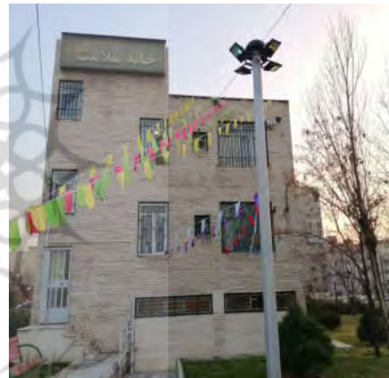
شکل ۱- تصاویری از ورودی گرمخانه‌های زنان در شهر تهران