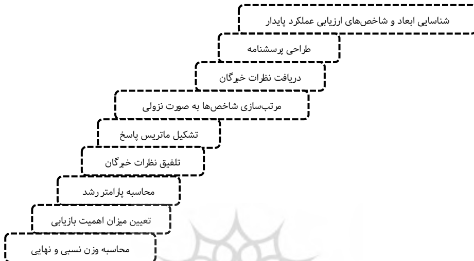
شکل ۱. مراحل روش سوارا فازی