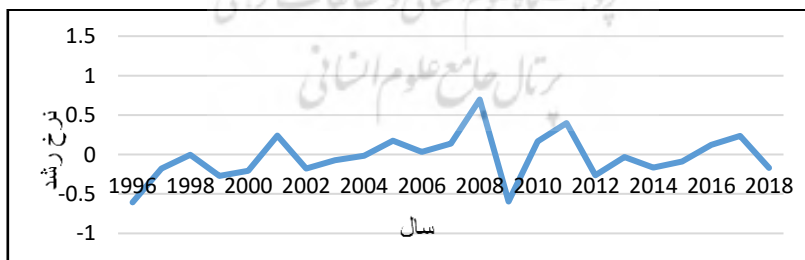
نمودار ۲. روند تغییر میانگین نرخ تورم در کشورهای اسلامی منتخب طی دوره ۱۹۹۵-۲۰۱۸ مأخذ: پایگاه بانک جهانی

تورم و شاخص پیچیدگی اقتصادی در کشورهای عضو سازمان همکاری اسلامی طی دوره ۱۹۹۵-۲۰۱۸ با نوساناتی همراه است. مطابق نمودار ۲ و نمودار ۳ که روند تغییرات نرخ تورم و شاخص پیچیدگی اقتصادی را طی دو دهه مورد مطالعه نمایش می‌دهد، ملاحظه می‌شود بیشترین نوسان‌های این دو شاخص مربوط به سال‌های ۲۰۰۷ تا ۲۰۱۲ است. به نظر می‌رسد بحران مالی سال ۲۰۰۷ و سرایت آن به بازارهای جهانی در وقوع این امر بی‌تأثیر نبوده است.