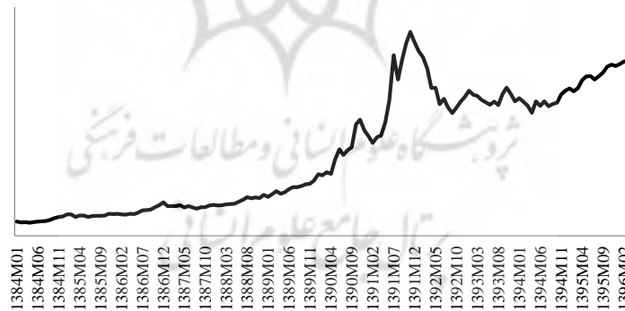
Fig.1. Gold coin time series value in Iran

شکل ۱: سری زمانی بهای سکه‌ی طلا در ایران