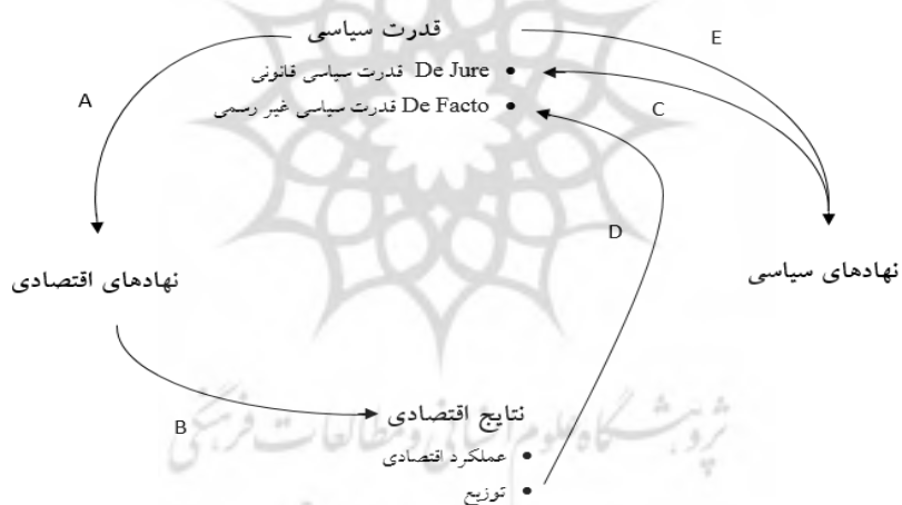
شکل ۱: چارچوب تحلیل رابطه میان نهادهای سیاسی و اقتصادی و نتایج اقتصادی

آسم اغلو و همکاران (۲۰۰۵) قدرت سیاسی را به دو نوع تقسیم بندی می‌کنند؛ قدرت سیاسی قانونی ۵۲ و قدرت سیاسی غیررسمی ۵۳ (شکل ۱). قدرت سیاسی قانونی برآمده از نهادهای سیاسی است (مسیر C در شکل ۱)، در حالی که قدرت سیاسی غیر رسمی بدون اتکا به نهادهای سیاسی کسب می‌شود به عنوان مثال قدرت سیاسی‌ای که در پی یک کودتا و تحولات انقلابی بدست می‌آید اغلب از نوع قدرت سیاسی غیررسمی است. نکته مهم این است که قدرت سیاسی غیررسمی بر پایه دسترسی به منابع امکان پذیر است (مسیر D در شکل ۱).