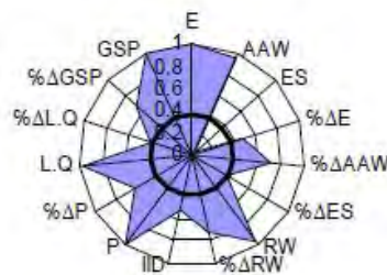
شکل 3: نمودار تار عنکبوتی خوشه‌ی صنعتی تولید وسایل نقلیه‌ی موتوری