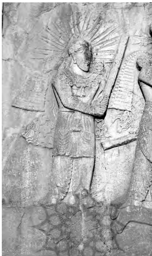
تصویر ۲. نقشی که نویسندگان آن را مهر پنداشته‌اند (Adrych, et al, 2017: Fig. 4.4)

می‌کنند که شاید گنجاندن مهر در این صحنه نمادین می‌تواند این باشد که تاجگذاری اردشیر در جشن مهرگان، روی داده است، اما چنین سخنی باید در حدس و گمان باقی بماند، زیرا هیچ گونه شواهد تاریخی دربارهٔ جزئیات به پادشاهی رسیدن اردشیر در دست نیست (Adrych, et al, 2017: 90). نویسندگان در ادامهٔ این فصل به نقش مهر در دین ساسانیان می‌پردازند و آن را تحلیل می‌کنند. فصل پنجم به نقش میرو در میان کوشانیان در سدهٔ یکم تا سدهٔ چهارم میلادی پرداخته است. در استان شمالی قلمرو کوشانیان یعنی بلخ، نام میرو شکل محلی میترا یا مهر است و خدای میرو در سدهٔ دوم میلاد نقش ارزنده و برجسته‌ای داشت. کوشانیان، میرو را در یک محیط نمادین پیچیده، هم بر سکه‌هایشان و هم در نیایشگاه‌های سلطنتی نقش می‌کردند. نویسندگان با پرداختن به مهر، او را با خدایان در پیوند با خورشید همچون سوریا هندی ۱ و هلیوس یونانی ۲ مقایسه می‌کنند. سکه‌ای زرین در زمان پادشاهی چهارمین فرمانروای کوشانی، کانیشکا (۱۲۷-۱۵۰) ضرب شده است که وزن آن ۷/۹۳ گرم و قطرش ۲۱ میلی‌متر است. تقریباً طلای ناب است و طراحی