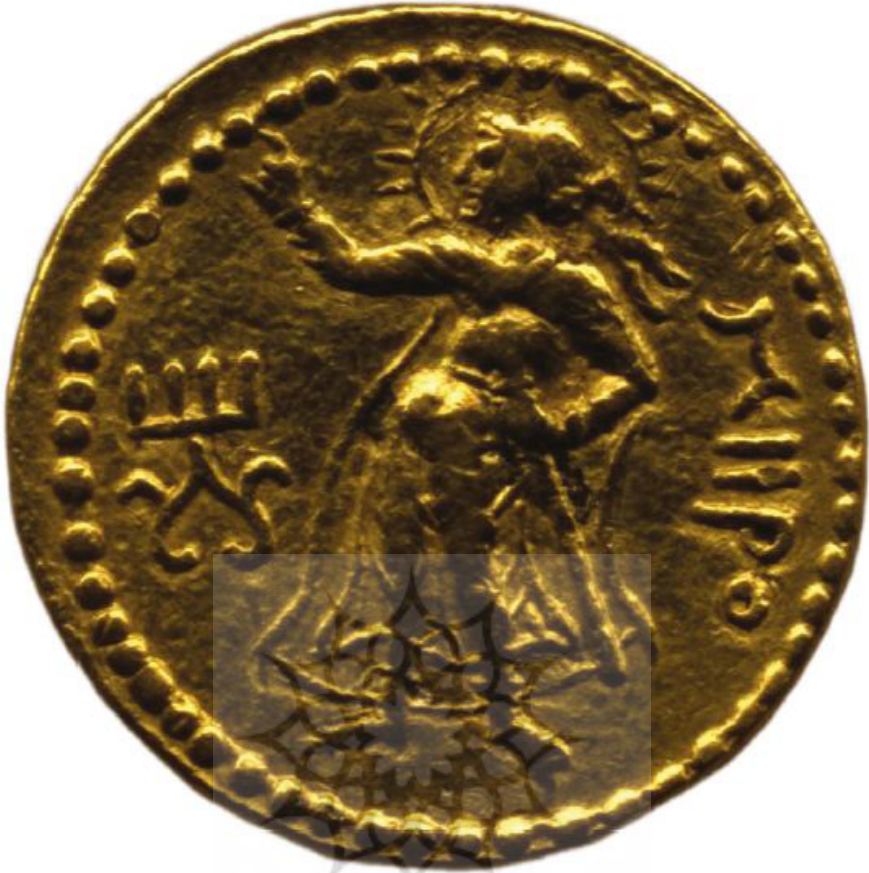
تصویر ۳. سکه زرین کائیشکا که میرو را نشان می دهد و در بلخ ضرب شده است (Adrych, et al, 2017: Fig. 5.1)

آن براساس سکه های زرین یونانی و رومی است. قالب این سکه در استان بلخ به احتمال در پایتخت بلخ ساخته شده است. بلخ باستان شمال شرق افغانستان امروزی و مناطق جنوبی تاجیکستان و ازبکستان را در بر می گرفت و مجموعه ای از دره ها و دشت های حاصلخیز میان کوه های هندوکش در جنوب و کوه های آلتایی در شمال است. پشت این سکه، میرو درحالی که بدنش رو به بیننده است، ایستاده است. بازویش را بالا آورده است و سرش به سمت چپ چرخیده است. موهایش کوتاه و فر است که با روبانی (دیپیم) که انتهای آن از پشت سرش آویزان است بسته شده است. او تونیک تنگ و شلواری به تن دارد - نمونه ای از تصویر کوچ نشینان آسیای مرکزی است - و زیر ردایی با دو قلاب بسته شده است. کمربندش نیام را نگه داشته است و با دست قبضه شمشیر را گرفته است و چکمه هایی به پا دارد. براساس پرتو درخشان گرداگرد سرش که صفت خدای خورشید است و نیز کتیبه ای که در سمت راستش است، میرو شناسایی شد (Adrych, et al, 2017: 106-107). فصل ششم این کتاب به آپولو-میترا در کماژن پرداخته است. نخستین بار در اواخر سده نوزدهم