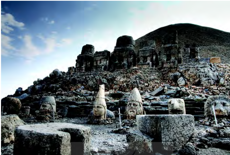
تصویر ۴. خدایان کماژن (Adrych, et al, 2017: Fig. 6.1)

که اغلب آتیس، پاریس ۳ و به‌ویژه میترا در غرب به سر دارند. بر پیشانی او، متمایز از تاج، یک دیهیم تزئین شده با دایره‌هایی چند قرار دارد. از پشت سر او پرتوهایی می‌درخشد که او را به‌عنوان خدای خورشید معرفی می‌کند. چهره او جوان است و بی‌ریش و با چشمانی درشت. نویسندگان در ادامه به دیگر نقش‌های «آپولو-میترا-هلیوس-هرمس» می‌پردازند و آنها را در مکان‌هایی چون سامسات ۴ در آدیامان ترکیه و سفراز کوی ۵ و زوگما ۵ بررسی و ارزیابی می‌کنند و از سبک آنها سخن می‌گویند.