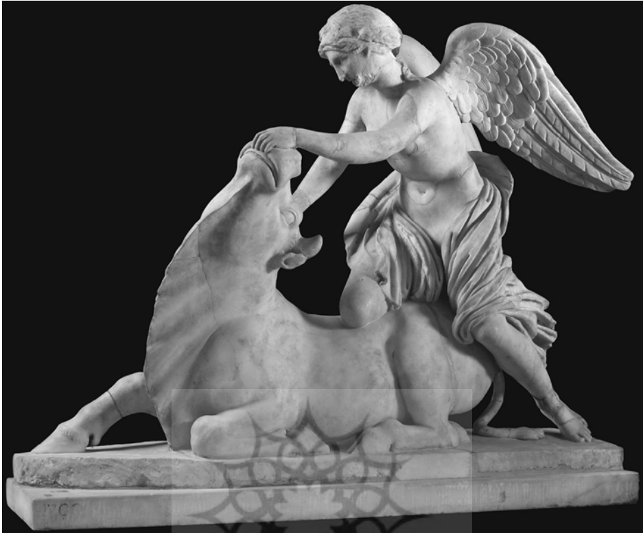
تصویر ۱. نیکه هنگام کشتن گاو نر، از ویلای آنتونوس پیوس، ایتالیا (Adrych, et al, 2017: Fig. 1. 6)

شاپور دوم حلقه‌ای را به دست اردشیر دوم می‌دهد درحالی‌که هر دو تن بر ژولیان شکست خورده ایستاده‌اند و نیز درحالی است که مهر به آن دو می‌نگرد. پرسشی را طرح می‌کنند که حضور مهر در این نقش برجسته را چگونه می‌توان تفسیر کرد؟ واگذاری اقتدار یا افتخار که نماد آن حلقه است، میراث دیرینه‌ای در هنر ایرانی دارد و نقشی رایج در نقش برجسته‌های صخره‌ای ساسانی است، اما گنجاندن مهر در این نقش برجسته نمایانگر نظارت مهر بر پیمان است. بنابراین اگرچه مهر در دیگر نقش برجسته‌های ساسانی دیده نمی‌شود، حضور او با توجه به این نقش چندان دور از انتظار نیست چراکه مهر در اینجا به پیمان میان دو پادشاه نظارت می‌کند. (Adrych, et al, 2017: 90). نویسندگان همچنین با احتمال و احتیاط پیشنهاد