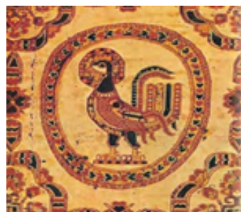
تصویر ۸. نقش خروس در پارچه ساسانیان (صابری و مافی تبار، ۱۳۹۹: ۸)