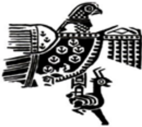
تصویر ۵. نقش عقاب در پارچه ساسانی (صادق‌پور فیروزآباد، ۱۳۹۶: ۱۰۹).