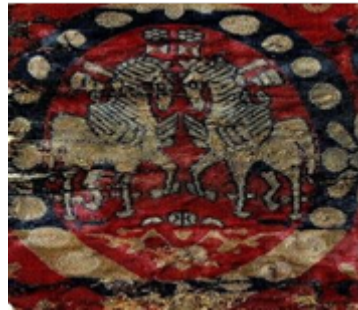
تصویر ۲. نقش اسب در پارچه ساسانی (صادق‌پور فیروزآباد، ۱۳۹۶: ۱۱۱).

را نمادی از اهریمن و شیطان و گاهی نیز نموداری از پدر خیر و شر دانسته‌اند. استفاده از نقوش جانوری، ریشه عمیقی در سنت‌های ایران باستان داشت و نقش شیر به اهمیت آن اشاره دارد. شیر، نگهبان نمادین پرستشگاه‌ها، قصرها و آرامگاه‌ها بوده و تصور می‌شد که قدرت او باعث دورکردن تأثیرات زیان‌آور می‌شود (طالب‌پور، ۱۳۹۴: ۵۸). در قسمتی از پارچه‌ای به جا مانده از دوره ساسانیان، نقش دو شیر به صورت قرینه رو به درخت نخل که در مقام درخت زندگی است، دیده می‌شود. درخت نخل، درخت مقدس و نماد باروری بوده است و شیرها به عنوان نگهبان این درخت حضور دارند. به نظر می‌رسد در راستای واقع‌گرایی کشیدن شیرها تلاشی نشده است. در قسمت بالایی قاب مدور طرح شیران که با سه ردیف از طرح‌های هندسی آذین شده، نقش سگ‌هایی در حال دویدن، به صورت قرینه تصویر شده است که مفهوم حرکت را برای بیننده القا می‌کند (تصویر ۳).