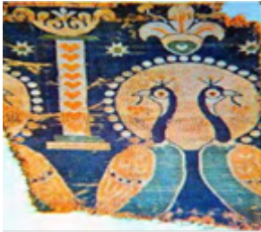
تصویر ۷. نقش طاووس در پارچه ساسانی (نامجو و فروزانی، ۱۳۹۲: ۳۳)