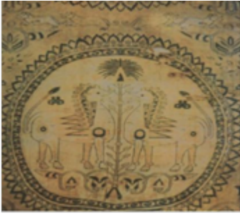
تصویر ۳. پارچه ابریشم ساسانی با نقش شیر (طالب‌پور، ۱۳۹۴: ۶۰).