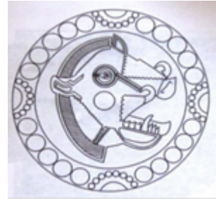
تصویر ۴. نقش سرگراز در پارچه ساسانی (جلیلی، ۱۳۹۲: ۱).

ساسانی می‌توان از عقاب، طاووس، خروس و مرغابی نام برد. در طرح آن‌ها به زیبایی ظاهری آنان و ارتباطی که با ایزدان دارند توجه شده است (جدول ۲).