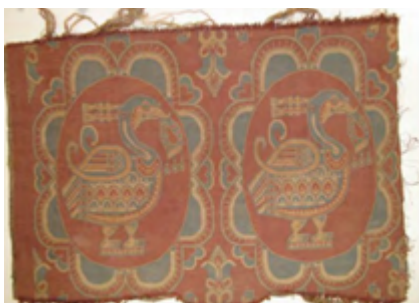
تصویر ۹. نقش مرغابی در پارچه ساسانیان (کریمی، ۱۳۹۸: ۲۷)