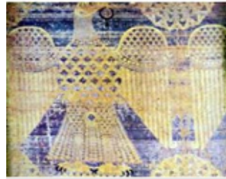
تصویر ۶. نقش عقاب بر ابریشم ساسانی (طالب‌پور، ۱۳۹۴: ۶۷)

بال‌ها، حس پرواز را نشان می‌دهد. ترکیب‌بندی این پارچه هم به صورت افقی و متقارن بوده است (تصویر ۶).