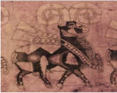
تصویر ۱. نقش قوچ در پارچه ساسانی (شجاعی قادیکلایی و مراثی: ۱۳۹۷، ۸۰).

مدالیون ۱ قرار دارد و قسمت پایینی پاها با مروارید آرایش شده است. می‌توان دریافت که ترکیب‌بندی کلی طرح پارچه به صورت افقی است و تکرار نقوش به صورت ردیفی منظم شده است (تصویر ۱).