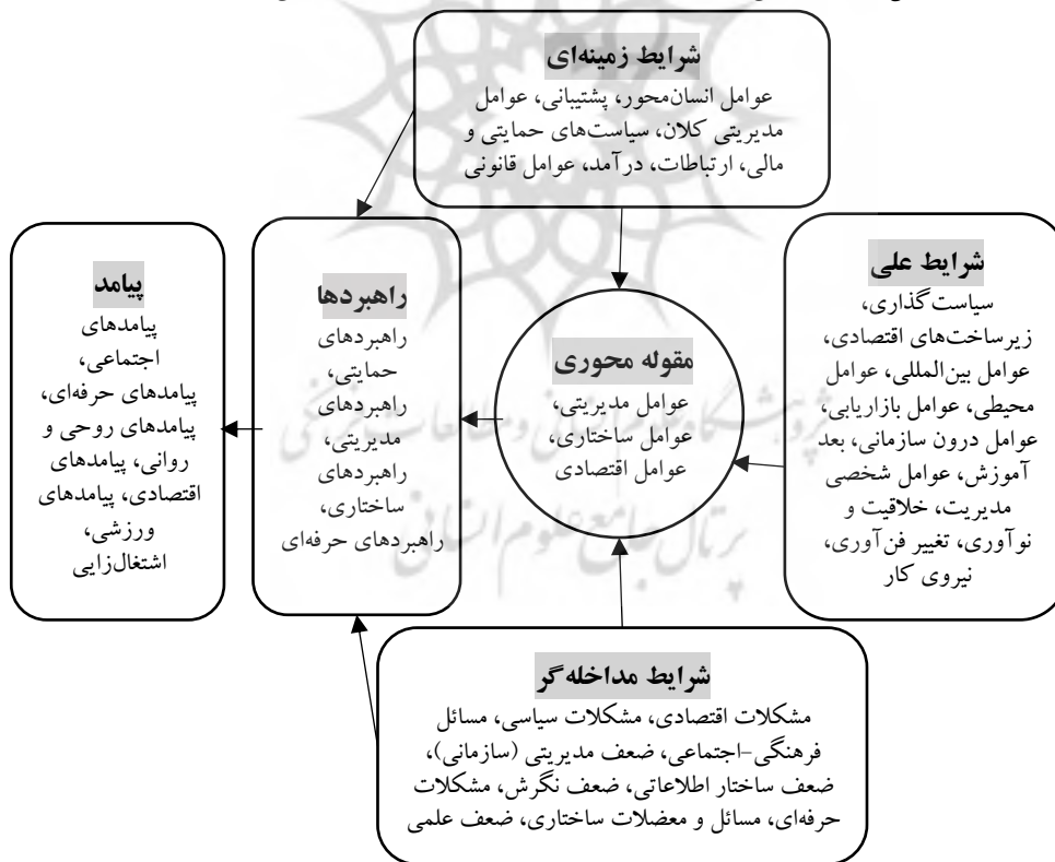
شکل ۱. الگو نهایی مدل مدیریت ایجاد و راه‌اندازی مهدهای ورزشی کشور