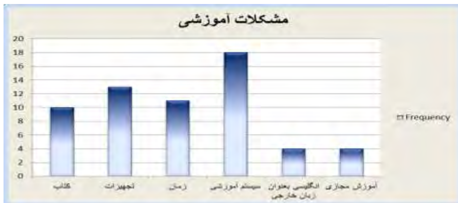
نمودار ۳. بسامد هر یک از انواع مشکلات آموزشی در پاسخ‌های معلمان

در نمودار شماره ۳ بسامد مشکلات مربوط به سیستم آموزشی بالاترین رتبه را به خود اختصاص داده است. در واقع مشکلات مربوط به سیستم آموزشی پربسامدترین معضل در پاسخ‌های معلمان شناخته شد. پس از آن مسئله‌های مربوط به تجهیزات و عدم وجود امکانات آموزشی کافی رتبه دوم را به خود اختصاص داده است و با فاصله کمتری مسئله عدم کافی بودن زمان و همچنین محتوای کتب درسی بعنوان پربسامدترین معضلات آموزشی در رتبه‌های سوم و چهارم قرار گرفتند. در نهایت، با فاصله نسبتاً زیادی از سایر مشکلات محیطی، دو معضل مربوط به آموزش مجازی و انگلیسی به عنوان زبان خارجی با کمترین بسامد در نمودار نشان داده شده‌اند.