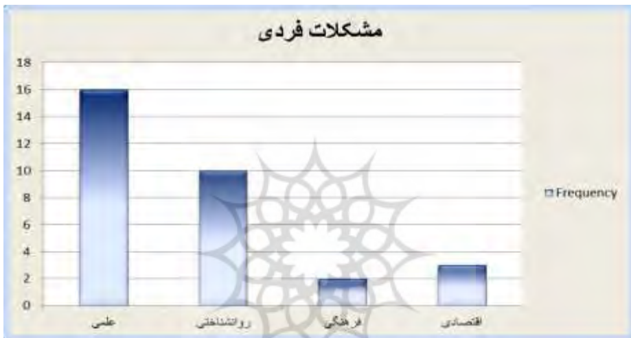
نمودار ۲. بسامد هر یک از انواع مشکلات فردی در پاسخ‌های معلمان

انواع مشکلات فردی (نمودار ۲) و مشکلات آموزشی (نمودار ۳) ترسیم گردید. نگاهی به نمودارهای میله‌ای مشکلات فردی و آموزشی بوضوح نشان می‌دهد که در وهله اول تعداد مشکلات آموزشی که شامل ۶ مورد می‌باشد در مقایسه با مشکلات فردی (۴ مورد) بیشتر است. لذا می‌توان نتیجه گرفت که ریشه معضلات معلمان را باید بیشتر در عوامل آموزشی یافت. همچنین نمودارها بسامد هر یک از مشکلات را در حوزه‌های فردی و محیطی به خوبی نشان می‌دهند.