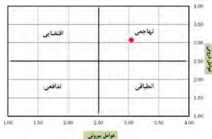
شکل ۲- ماتریس ارزیابی عوامل درونی و بیرونی و وضعیت حوضه آبریز مورد بررسی در راهبردهای چهارگانه